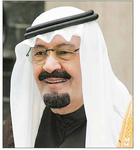
الملك عبدالله بن عبدالعزيز