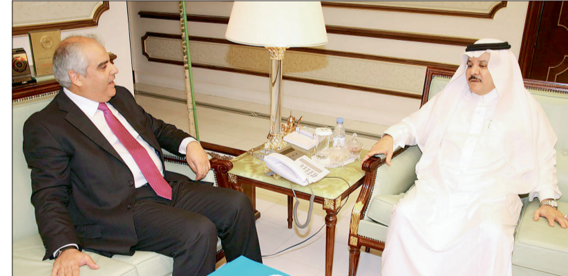
د. ساعد العرابي الحارثي مستقبلاً ممثل منظمة اليونيسيف أمس.

بحث مستشار سمو وزير الداخلية الدكتور ساعد العرابي الحارثي بمكتبه بالوزارة أمس مع ممثل منظمة الأمم المتحدة للطفولة «اليونيسيف» الدكتور إبراهيم الرزيق أوجه التعاون بين الحملة الوطنية السعودية لنصرة الأشقاء في سوريا والمنظمة.