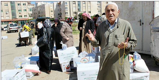
سوريون لدى تسلمهم المعونات السعودية.