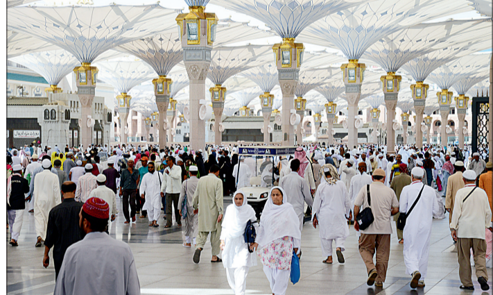
زوار يستظلون بمظلات المسجد النبوي.

وسخر كافة الجهود لخدمة الحرمين، وأضاف أن المسجد النبوي الشريف به من المشاريع الكبرى التي نفذت أو تنفذ حالياً مثل التوسعة الكبرى التي ساعدت كثيراً على راحة المصلين واطمئنانهم، كما أن الملك دعم المسجد النبوي بالكوادر والآليات وجميع المستلزمات، وقبل فترة قريبة قدم للمسجد النبوي عشرة آلاف مدة وسجادة جديدة، وهذا ليس بمستغرب على ولاة الأمر، حيث إن المسجد النبوي يحظى بالرعاية والاهتمام من ولاة الأمر في هذه البلاد، كما أن هذا المسجد في قلب خادم الحرمين وله أيام بيضاء في هذا الجانب ولا يدخر وسعاً في ذلك، وهذا مشاهد وملحوس لكل زائر ومصل.