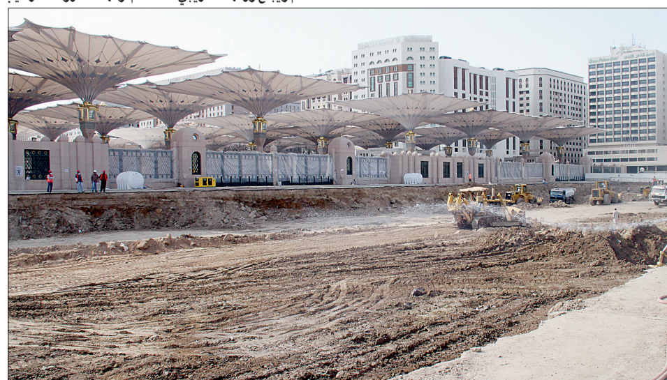
جانب من توسعة الحرم النبوي.

للتواصل أرسل sms إلى ٨٨٥٤٨ الاتصالات ٦٣٢٥٠٠ موبايي، ٧٣٨٢٠٢ زين تبدأ بالرمز ١٥٨ مسافة ثم الرسالة aokhayat@yahoo.com