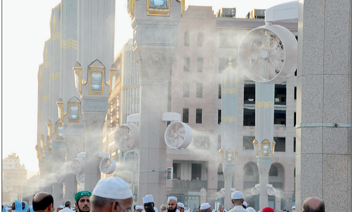
مراوح الرذاذ في ساحات المسجد النبوي.