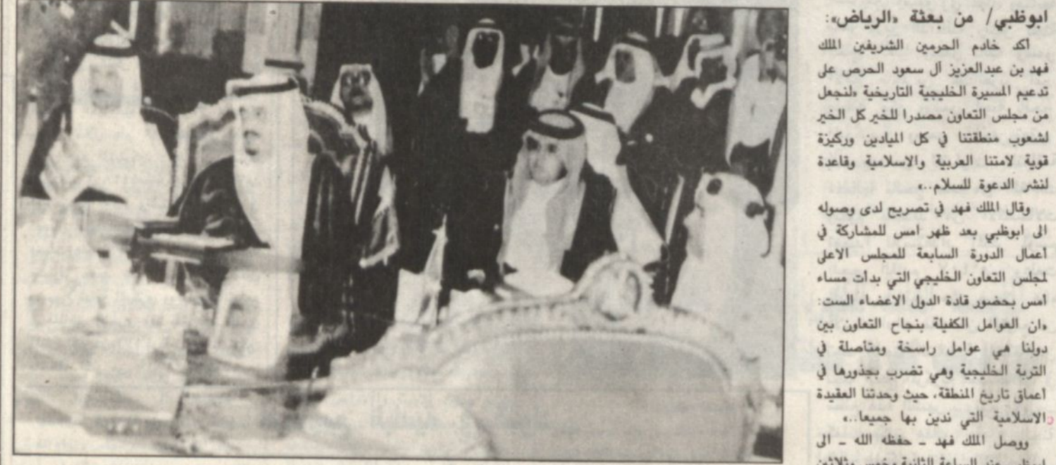
الامير سلطان بن عبدالعزيز آل سعود الفيصل وزير الخارجية مع امراء دول الخليج في ابوظبي.

«لقد عقدنا العزم على ان نجعل من هذا المجلس مصدراً خيراً شعوبنا.. وركيزة قوية لأمتنا العربية والاسلامية» اترار جدول الأعمال في جلسة مغلقة، وجلسة العمل الأولى تبدأ صباح اليوم