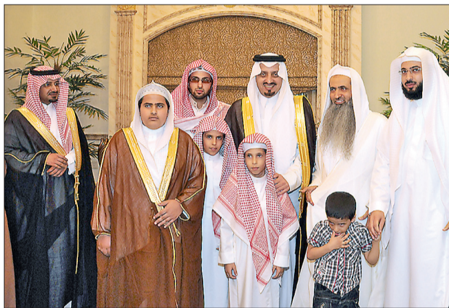
○ أمير عسير معاعيدا عبدالعزيز بن مشيط وأحمد الحواشي. (عكاظ) ○

هذه المناسبة عواما عديدة وأزمنة مديدة. رافق سموه في الزيارات الوكيل المساعد الدكتور محمد بن محمد بن عيسى ومدير مكتب سمو أمير المنطقة محمد بن مجتل ورئيس الشؤون الخاصة فيصل بن مشرف وعدد من المسؤولين بالمنطقة. من جهة أخرى أجرى أمير المنطقة البارحة الأولى اتصالا هاتفيا بأشقاء وأبناء المخرج التلفزيوني بمحطة تلفزيون أبها إبراهيم يحيى معافا الذي توفي إثر نوبة قلبية دامت له قبيل مغيب شمس أول أيام عيد الفطر، ودعا الأمير فيصل بن خالد، الله أن يرحم المتوفى وأن يجبر مصاب ذويه وأن يلهيهم الصبر والسلوان، مؤكدا سموه بأن الفقيد خدم المنطقة وكان مشهودا له خلقه الرفيع. وقدم ذؤو المفوف شكرهم وتقديرهم لسموه على مشاركته لهم في مصابهم، داعين الله إلى بري سموه مكروما.