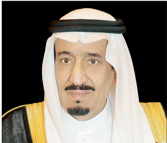
الأمير سلمان بن عبدالعزيز