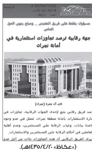
قائد آل بجرة (مركز)

لفتح فريق من وزارة الشؤون البلدية والقروية تحقيقا مع عدد من مسؤولي إدارة الاستثمار في أمانة منطقة نجران، على خلفية رصد تجاوزات في عملية طرح المناقصات، وتهجم مديرها على فريق رقابي خلال أدائه مهامه الرسمية، وعدم تمكنه لهم من رصد التجاوزات التي تمارسها استثمارات الأمانة مع صغار المستثمرين. وأكد مصدر مطلع أن الفريق الوزاري استجوب مسؤولين بالأمانة من خلال تحقيق موسع اشتمل على أوجه الخلل الذي تعاني منه الإدارة، وأسباب الهجوم على موظفي الدولة خلال أداء مهمتهم في مراقبة سير العمل داخل إدارة الاستثمارات التي كشف الفريق الرقابي أنها تفقر إلى قاعدة بيانات. وأشار المصدر إلى أن الفريق الوزاري حرص على مقابلة الفريق الرقابي الذي كشف عن أوجه الخلل، مما عرضه