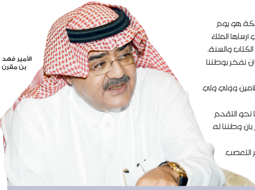
الأمير فهد بن مقرن

أكد صاحب السمو الملكي الأمير فهد بن مقرن أن اليوم الوطني للمملكة هو يوم تجسد فيه أجمل المصائب والصور، مستلهمة سطوراً من التضحيات والبطولات التي أرساها الملكة الموحدة عبدالعزیز بن عبدالرحمن آل سعود (طيب الله ثراه) على منهج ثابت فواهم الكتاب والسنة، وفان سموه أن الكلمات تستمدح لتصف مشاركتنا وكانها تشاركنا المرح فحق علينا أن نخضر بوطننا ومبادئنا وشمسنا. وهنا الأمير فهد خادم الحرمين الشريفين الملكة عبدالله بن عبدالعزیز ووليه عهدة الأمين ووليه ولي العهد (حفظهم الله) باليوم الوطني الـ ٨٤ لتوحيد وتأسيس المملكة. وبين سموه أن اليوم هو يوم إيمان فخرنا لخادم الحرمين الشريفين الذي سار بوطننا نحو التقدم والتطور على الصعيدين الاقتصادي والسياسي، لننعم بالامن والأمان والرخاء، ونفاخر بان وطننا له هذا النبل الدائم على المستويات الملمحة. ونوه في حوار خص به «عكاظ» على أهمية اللحمة الوطنية، والقضاء على مظاهر التنصب، وتوحيد أبناء القبائل على المنهج الذي بدأ به جلالته الملكة عبدالعزیز بن عبدالرحمن آل سعود (طيب الله ثراه) وسار على خطاه إبانها من بعده فانه نص الحوار ..