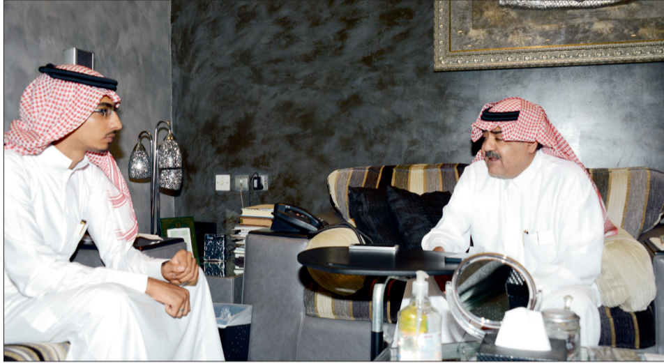
الأمير فهد بن مقرن متحدثاً للزميل عادل باكير.

ينير بصائرهم ويعيدهم إلى وطنهم آمنين، وأقول لهم ما هذا إلا غشاء ضللكم، عودوا إلى بلدكم وحققوا الخير لها واخدموها فهي تنتظر شباباً صالحين وارتكوا هذه الأعمال الإرهابية التي لا تمت للإسلام بأي صلة، وهناك الكثير من الشباب التي نستطيع الاتكال عليهم وهم على قدر من المسؤولية فهناك الكثير منهم مبدعون في هندسة الطيران والهندسة المعمارية والمقاولات والأطباء وغيرهم، ونتمنى لهم مزيداً من التوفيق لخدمة الوطن.