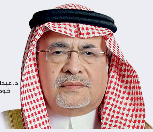
د. عبدالعزيز خوجة

سابقة الزمن لإنجاز تلك المشاريع وتحقيق الرفاه والراحة للمواطن. وأشار وزير الثقافة والإعلام إلى أن تقرير صندوق النقد الدولي يبرهن على متانة الاقتصاد السعودي وبسبب الأنظمة والقوانين التي تصدت بها لتدابير الأزمة الاقتصادية العالمية، التي عانت منها اقتصادات كثير من الدول الصناعية، وأنه أظهر حكمة السياسات الاقتصادية التي اتبعتها المملكة خلال الفترة الماضية، مؤكداً أن تلك السياسات جنبت المملكة كثيراً من الأزمات الاقتصادية وأسهمت في استقرارها. وأوضح الدكتور خوجة، أن السعودية حافظت على استقرار سوق النفط العالمي من خلال التزامها بتزويد السوق العالمي بكميات إضافية من النفط، إذا دعت الحاجة لذلك، لمواجهة أية ارتفاعات محتملة في الأسعار أو نقص في الأسواق العالمية، مضيفاً أن قطاع النفط والغاز شهد في عهد خادم الحرمين الشريفين الملك عبدالله بن عبدالعزیز (حفظه الله) نهضة عملاقة ساهمت في تعزيز جوانب التنمية بالمملكة، وتحسين المستوى المعيشي للشعب السعودي، ووضعت المملكة في مكانة متميزة ومرموقة في مشهد الاقتصاد العالمي، حيث تحولت من مصدر للنفط الخام فقط إلى منتج عالمي رائد متكامل للطاقة والبتر وكيمياويات.