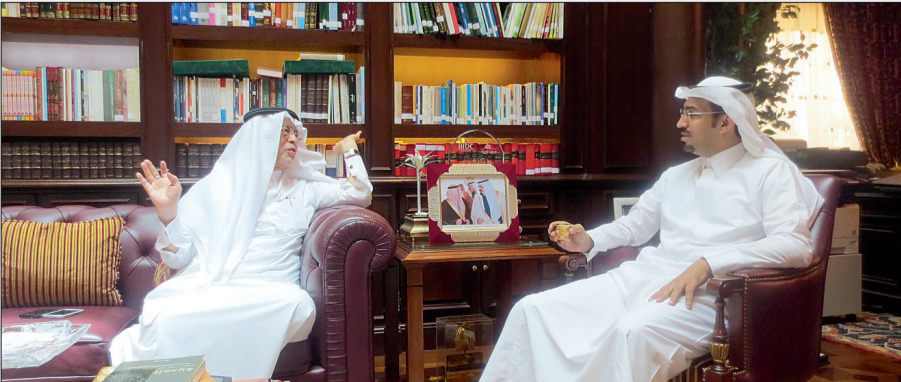
د. خوجة متحدثاً للزميل عبدالله عبيان.

البلاد من تجربة رائدة في شتى المجالات. الحرب على الإرهاب واستطرد وزير الثقافة والإعلام، أن «المملكة تعرضت لكثير من التحديات الأمنية ومنها أفة الإرهاب التي استطاعت المملكة بفضل قيادتها الحكيمة وبقظة رجال الأمن، التعامل معها بحزم واجتهادها من جذورها»، مبيناً أن حرب المملكة على الإرهاب لم تقتصر على الداخل، بل امتدت إلى خارج حدود الوطن من خلال سعي المملكة لتجفيف منابع الإرهاب ومنع تمدده، من خلال التنسيق مع الدول الأخرى وتقديم الدعم السخي للمنظمات الدولية المعنية بمكافحة الإرهاب عالمياً. وأضاف خوجة، أن قرار خادم الحرمين الشريفين الملك عبدالله بن عبدالعزیز بتجريم المشاركة في الأعمال القتالية خارج المملكة ودعم الجماعات الإرهابية، يعد خطوة متقدمة في مسيرة المملكة اللاحقة لمكافحة الإرهاب والتطرف، كما أن تبرع المملكة مركز