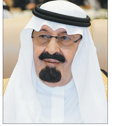
الملك عبدالله بن عبدالعزيز

ثمنت وزارة الأوقاف المصرية المبادرة الكريمة التي طرحها خادم الحرمين الشريفين الملك عبدالله بن عبدالعزيز -حفظه الله ورعاه، بترميم جامع الأزهر الشريف، مؤكداً أن هذا ليس بغريب على شخصية كبيرة وحكيمة وقائد كخادم الحرمين الشريفين «حكيم العرب». وقال الدكتور محمد مختار جمعة وزير الأوقاف المصري في بيان أصدره أمس وحصلت «عكاظ» على نسخته، «تتوجه وزارة الأوقاف بخالص الشكر والتقدير إلى خادم الحرمين الشريفين الملك عبدالله بن عبدالعزيز، على قراره الكريم بترميم جامع الأزهر الشريف على نفقة المملكة تقديراً من جلالته لدور الأزهر الشريف في نشر سماحة الإسلام، وليس ذلك بمستغرب من شخصية كبيرة وحكيمة وقائد كخادم