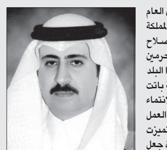
الأمير فيصل بن سلطان

برى الأمير فيصل بن سلطان بن عبدالعزيز، الأمين العام لمؤسسة سلطان بن عبدالعزيز آل سعود الخيرية، أن المملكة تعيش الآن أزهى عصورها حيث حققت مسيرة الإصلاح والتنمية بفضل من الله ثم برعاية ودعم خادم الحرمين الشريفين -رعاه الله- داعياً الله العلي القدير أن يحفظ لهذا البلد الطيب أمنه واستقراره، وأشار سموه إلى أن قيادة المملكة باتت قادرة وتحظى داخل وخارج الوطن في تحمل المسؤولية والالتناء والعطاء والعمل على الاستقرار بوجه عام، والتفاعل مع العمل الخيري والإنساني بوجه خاص. وأضاف سموه «إن ما تميزت به المملكة على مدى سنوات من مبادرات إنسانية متفردة جعل منها نموذجاً لدولة الإنسانية، وصورة رائعة للمجتمع المسلم القائم على التسامح والتكافل والترامح.