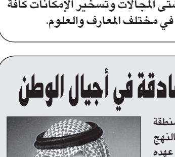
الأمير مشعل بن عبدالله

الأمير مشعل بن عبدالله بن عبدالعزيز أمير منطقة مكة المكرمة قال في كلمته بمناسبة اليوم الوطني: منذ عهد الملك عبدالعزيز -طيب الله ثراه- شهدت المملكة إنجازات وقفزات تنموية كبيرة شملت كافة أرجاء الوطن وفي مختلف المجالات التعليمية والصحية والبلدية والطرق وغيرها من المشروعات التي تصب في خدمة المواطن، واستمرت المسيرة حتى هذا العهد الزاهر لسيدي خادم الحرمين الشريفين الملك عبدالله بن عبدالعزيز حفظه الله ورعاه والذي سخر كل الوقت والجهد