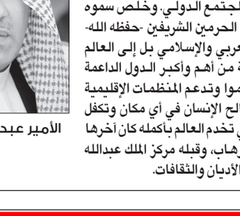
الأمير عبدالعزيز بن عبدالله

أكد الأمير عبدالعزيز بن عبدالله بن عبدالعزيز نائب وزير الخارجية، أن المملكة تسعى لإحلال الأمن والسلام الدوليين في العالم ليعم السلام والرخاء والعدالة السامية التي قامت عليها وانطلقت منها سياساتها الخارجية، حيث حققت علاقات وطيدة بدول العالم لتكون علاقات تخدم مصلحة الإسلام والمسلمين، وأصبح لها الدور الريادي الإسلامي والسياسي والاقتصادي والاجتماعي والإنساني، لخدمة الإسلام والمسلمين في شتى بقاع الأرض، كما أصبحت مواقفها في الدفاع عن قضايا الأمة العربية والإسلامية في المحافل الدولية محل تقدير واهتمام، واستثمرت علاقاتها الطيبة مع الدول الصديقة المؤثرة لتحقيق أهداف سامية للأمتين العربية والإسلامية.