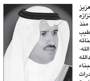
الأمير فيصل بن سلمان

عبر الأمير فيصل بن سلمان بن عبدالعزيز أمير منطقة المدينة المنورة عن فخره واعتزازه بما تحققت من إنجازات على مستوى الوطن منذ توحيد على يدي المؤسس الملك عبدالعزيز -طيب الله ثراه- وخلال فترات الحكم الزاهره لأبنائه الملوك سعود و فيصل وخالد وفهد -رحمهم الله- وحتى عهد خادم الحرمين الشريفين الملك عبدالله بن عبدالعزيز -حفظه الله- الذي قاد مسيرة البناء وفتح آفاقاً جديدة للتنمية الوطن وبناء قدرات المواطنين، حيث حظيت منطقة المدينة المنورة بنصيبها من المشاريع التنموية الكبرى في إطار استراتيجية التنمية المتوازنة في جميع المناطق.