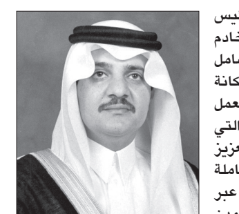
الأمير سعود بن نايف

قال الأمير سعود بن نايف بن عبدالعزيز أمير المنطقة الشرقية: إننا نعيش اليوم جميعاً فرحة يومنا الوطني المجيد الرابع والثمانين لبلادنا وما يمثلته من تاريخ مهم ومحوري نتذكر ما حققناه عبر عقود وجيزة في عمر الدول لتصبح المملكة منبع الخير وملقبة أفئدة المسلمين ورافدهم الكبير إنما كانوا نتيجة ما تقدمه حكومتنا الرشيدة بقيادة خادم الحرمين الشريفين الملك عبدالله بن عبدالعزيز آل سعود، وصاحب السمو الأمير الملكي الأمير سلمان بن عبدالعزيز آل سعود ولي العهد نائب رئيس مجلس الوزراء وزير الدفاع، وصاحب السمو الملكي الأمير مقرن بن عبدالعزيز