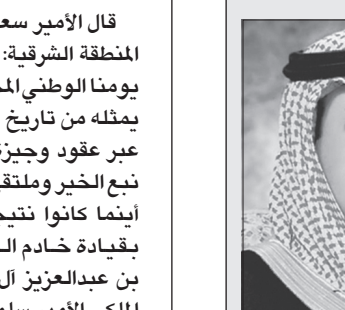
الأمير فهد بن بدر

شدد الأمير فهد بن بدر بن عبدالعزيز أمير منطقة الجوف على أن اليوم الوطني لا ينبغي أن يمر دون أن ندرك أنه إحياء لذكرى خالدة، هي ذكرى توحيد هذا الوطن الغالي على يد المغفور له الملك عبدالعزيز بن عبدالرحمن آل سعود -رحمه الله-، حيث أصبح هذا الوطن المرآة التي انعكس فيها كل أبناء هذا الوطن المتحابين تحت مسمى واحد «المملكة العربية السعودية». وقال: إن من أعظم النعم التي نلتها بلادنا نعمة التوحيد وإخلاص العادة لله عز وجل، ميمناً أنه من فقد النعمة خرج عن جادة الدين ودخل في مناهة الانحراف الفكري، وهو ما انتهى بأصحابه إلى الإرهاب في الداخل والخارج، وتأكيداً لذلك فقد أسس خادم الحرمين الشريفين -حفظه الله- مبدأ الحوار مع اتباع الديانات الأخرى ونشر منهج التسامح وقبول الآخر.