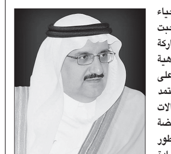
الأمير منصور بن متعب

قال الأمير الدكتور منصور بن متعب بن عبدالعزيز وزير الشؤون البلدية والقروية: إن إحياء ذكرى اليوم الوطني يستحضر القيم والمفاهيم والتضحيات والجهود المضنية التي صاحبت بناء هذه البلاد الغالية، لتعبر عما تكنه صدورنا من محبة وتقدير لهذه الأرض المباركة ولأبنائها المخلصين الذين كان لهم الفضل بعد الله تعالى في ما نتمتع به بلادنا من رفاهية واستقرار، فلم تتوقف مسيرة الخير والنماء ولله الحمد منذ أن جمع الله شمل هذه البلاد على يد المؤسس طيب الله ثراه والذي جعل من تاريخ هذا الوطن أنموذجاً للحكم والادارة استمد مبادئه وأسس من الشريعة الإسلامية وعمل على تنمية البلاد وتطويرها في مختلف المجالات وحمل من بعده أبنائهم البررة الرسالة وتابَعوا المسيرة فساروا على نهجه، وشهدت البلاد نهضة تنموية متواصلة في مختلف المجالات إلى أن وصلت إلى ما هي عليه من تقدم ورفق وتطور شامل وخاصة في مجال العمل البلدي والذي كان ولا يزال يحظى بالاهتمام والدعم من القيادة الرشيدة مما مكّنه من القيام بأداء مهامه ومسؤولياته وتنفيذ استراتيجيته طويلة الأمد لتحقيق التنمية العمرانية في كافة مدن ومحافظات المملكة وشمولها بكافة الخدمات البلدية.