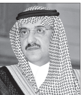
الأمير محمد بن نايف

والصحة والسكنية والمعيشية في مختلف مناطق ومحافظات المملكة، وكل ذلك في ظل مناخ آمن متميز تحقق بفضل الله ثم بفضل رعاية وتوجيه ودعم خادم الحرمين الشريفين لجهود أجهزة الأمن ورجاله المخلصين في كافة ميادين العمل الإنساني وتنمية قدراتهم وإمكاناتهم على نحو مكنهم بعد توفيق الله من التصدي بكل شجاعة وقدره ومهارة للهجمات الإرهابية الشرسة التي تتعرض لها المملكة وتستهديهم وأمنها واستقرارها وتعطيل مسيرتها التنموية ودورها المؤثر إقليمياً وعالمياً واستطاعت المملكة بتوفيق الله ثم بالرعاية الكريمة من لدن خادم الحرمين الشريفين أن تقدم للعالم تجربة سعودية رائدة في مكافحة الإرهاب والإرهابيين هي محل إعجاب وتقدير الجميع واستفاد منها العديد من الدول في جهودها تجاه مكافحة الإرهاب والفكر المتطرف.