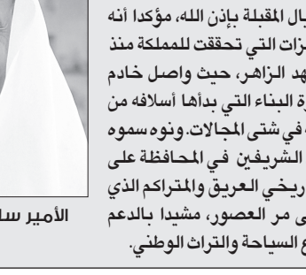
الأمير سلطان بن سلمان

قال الأمير سلطان بن سلمان بن عبدالعزيز رئيس الهيئة العامة للسياحة والآثار قال إن قائد مسيرة هذه الدولة المباركة خادم الحرمين الشريفين الملك عبدالله بن عبدالعزيز جعل تحقيق التطور الحضاري والاقتصادي للمملكة هدفاً أساسياً يعمل من أجله، ويتابعه ويدعمه شخصياً من خلال دعم المشاريع وسن الأنظمة الجديدة المتوائمة مع حركة التطور السريعة، والرامية إلى تحقيق المستوى المتطور الذي نعيشه في الوقت الحاضر، ووضع الأسس لنهضة مستقبلية