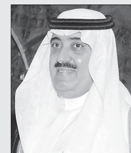
الأمير متعب بن عبدالله

وفهد) ورحمهم الله جميعاً، وصولاً إلى عهد خادم الحرمين الشريفين الملك عبدالله بن عبدالعزيز آل سعود حفظه الله. وقال إن ما تحقق لهذه البلاد المباركة وإنسانها يتطلب منا جميعاً العمل على تعزيز أمنها وأمانها قولاً وعملاً، أفراداً ومؤسسات والدفاع عن مقدساتها وصيانة مقدراتها وحماية مكتسباتها، وعدم الانجراف خلف الشعارات الزائفة والتيارات الفكرية الهدامة، مشدداً على أن مسؤولية المواطن تجاه وطنه عظيمة من أجل الحفاظ على أمنه واستقراره والوقوف في وجه كل من يحاول زرع الفتنة أو التأثير على أفكار شبابنا وتوجهاتهم بأي شكل كان، فشابنا هم عماد الوطن وسواعد بنائه وركائز تنميته، وهم في الأساس نتاج فكر إسلامي معتدل ومجتمع يفخر بقيمه وأصالته.