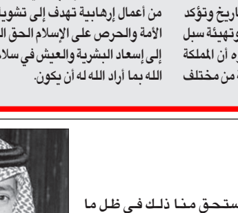
الأمير تركي بن عبدالله

والمضي قدماً بعزيمة وإرادة قوية وإيمان راسخ بالأهداف السامية النبيلة في بناء المستقبل، مستلحمين بالمعقيدة السلمية والولاء لولاة الأمر الكرام فلا مكان بينهم للغلو أو التطرف ولا مجال للجهل أو الكسل مدركين ما يحكيه الحاسنون الحاقدون على مقدساته والطامعون في خيراتهم، مستلهمين من الآباء والإجداد روح العطاء والإقدام