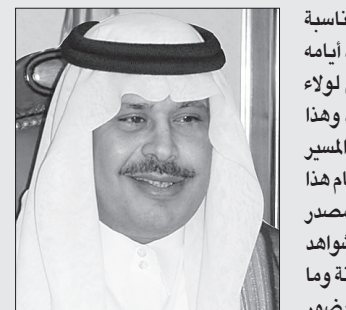
الأمير مشاري بن سعود

عبر الأمير مشاري بن سعود بن عبدالعزيز أمير منطقة الباحة عن مشاعره بهذه المناسبة قائلاً: ونحن نحتفل بهذه الذكرى على نفوسنا جميعاً، نسترجع صورة الماضي وقسوة أيامه ونستلهم من هذا الإرث الكبير ما تحقق لوطننا من رفاهية ورخاء ومكانة مستحقق لولاء الهمم الصادقة وعزيمة الرجال الأوفياء وتضحيات قادة هذا الوطن من أجل إنسانها، وهذا يستدعي منا استتعاظ مسؤولية قيمة هذا العطاء وأهمية المحافظة عليه ومواصلة درب المسير على خطى الأوتار، وتفتيح الفرصة أمام أعداء النجاج والحاقدين الذين ما فتئوا منذ قيام هذا الكيان في حبك المؤامرات لعرقلة مسيرته المعطاءة، والأيام وحدها أثبتت أن المملكة هي مصدر الإلهام لكل عطاء تنموي ورائدة لكل ما فيه من الإسلام والمسلمين وبإدعية للسلام والشواهد والحقائق على الأرض والمخالف في أبلغ دليل. وأضاف: ولعلنا جميعاً نرى المرحلة الراهنة وما يعصف بكثير من الدول المجاورة من فتن واضطرابات عطلت مسيرة الحياة وعكزت حضور الإنسان، والمملكة تسير بفضل الله ثم بقيادته الحكيمة ووعي مواطنيها بخطى سليمة إلى مدارج التطور والأزدهار، وقد عقدت مشاريع الخير والبناء لك جزء من الوطن الحبيب.