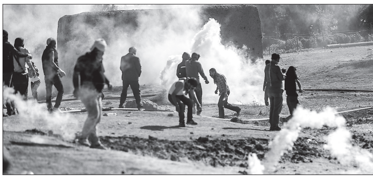
مواجهات بين الأمن التركي والأكراد قرب معسكر للاجئين السوريين على الحدود.

البلدة، بحسب المرصد. من جهة ثانية، وصل أكثر من ١٢٠ الف لاجئ غالبيتهم من الأكراد إلى تركيا هربا من تقدم تنظيم «داعش» في شمال شرق سوريا، حيث يحاصر بلدة عين العرب الاستراتيجية.