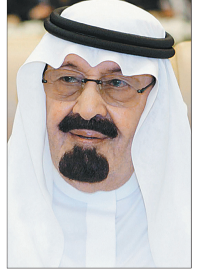
الملك عبدالله بن عبدالعزيز

يرعى خادم الحرمين الشريفين الملك عبدالله بن عبدالعزيز آل سعود، فعاليات المؤتمر السعودي الدولي للعلوم والتقنية، الذي تنظمه مدينة الملك عبدالعزيز للعلوم والتقنية خلال الفترة ٢١-٢٢ ذي القعدة ١٤٢٥هـ، بحضور نخبة من الخبراء والمختصين وذلك في مقر المدينة بالرياض.