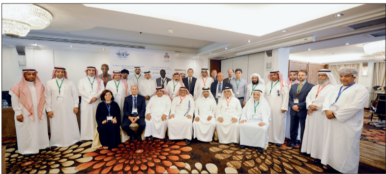
المشاركين في الاجتماع الخامس للمجموعة الفرعية للأرصاد الجوية أمس في جدة.

استضافته الرئاسة العامة للأرصاد وحماية البيئة بالتعاون مع المكتب الإقليمي لمنظمة الطيران المدني الدولي «إيكو» التي يشارك فيها ممثلو الدول الأعضاء في إقليم الشرق الأوسط والذي يضم في عضويته (١٥) دولة، بالإضافة إلى عدد من المنظمات والهيئات الإقليمية والجهات الحكومية المعنية وخطوط الطيران.