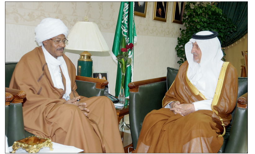
الأمير خالد الفيصل مستقبلا السفير عبدالعظيم إبراهيم.

حديثا لدى المملكة محمد حسين محمد ونائب رئيس البعثة يو ال نياس. وتم خلال اللقاءين تبادل الأحاديث الودية، ومناقشة عدد من الموضوعات ذات الاهتمام المشترك بين البلدين.