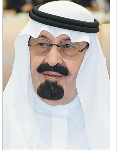
الملك عبدالله بن عبدالعزيز