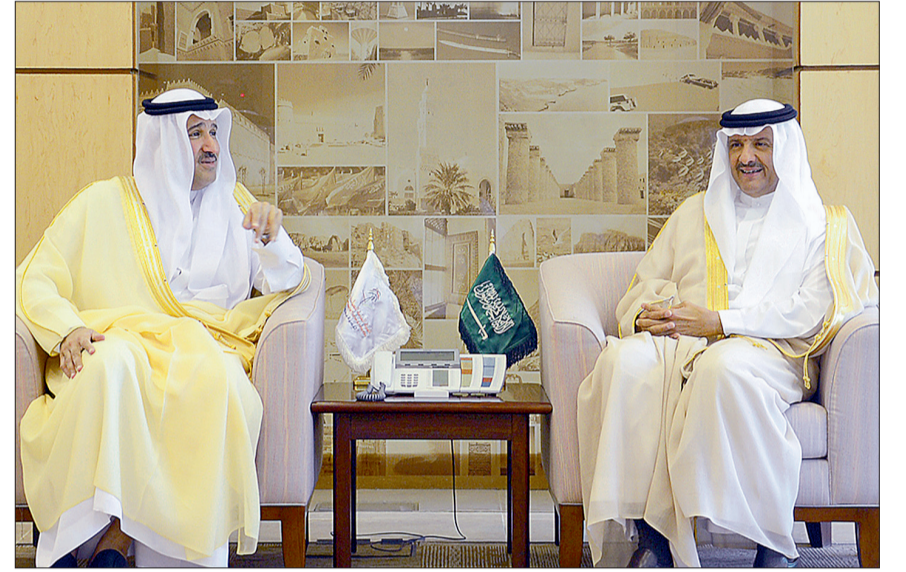
الأمير سلطان بن سلمان مستقبلاً أمير منطقة المدينة المنورة أمس.

من المشروعات المتعلقة بالسياحة والتراث الوطني في منطقة المدينة المنورة، التي تغفها الهيئة بالشراكة مع مجلس التنمية السياحية بالمنطقة. ومن أبرز تلك المشروعات مشروع تأهيل البلدة التراثية بالعمارة، ومشروعات الترميم في حي الصور بينبع، وتطوير متحف المدينة المنورة والعلا، ومشروع الوجهة السياحية بالرئيس، والحرف والصناعات اليدوية بالمنطقة.