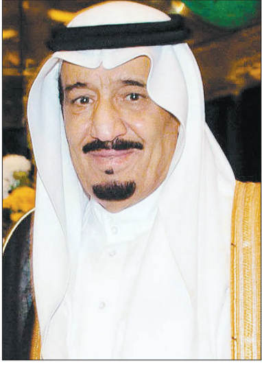
الأمير سلمان بن عبدالعزيز

عن أصدق التهاني وأطيب التمنيات بالصحة والسعادة لفخامته، ولحكومة وشعب جمهورية أوزبكستان الشقيق اطراد التقدم والازدهار. كما بعث صاحب السمو الملكي الأمير سلمان بن عبدالعزيز ولي العهد نائب رئيس مجلس الوزراء وزير الدفاع برفقة تهنئة لفخامة الرئيس إسلام كريموف رئيس جمهورية أوزبكستان بمناسبة ذكرى يوم الاستقلال لبلادها. وعبر سمو ولي العهد عن أبلغ التهاني وأطيب التمنيات بموفور الصحة والسعادة لفخامته ولحكومة وشعب جمهورية أوزبكستان الشقيق المزيد من التقدم والازدهار.