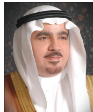
عبد الله بن صالح العثيمين

أرفع التهنئة لمقام خادم الحرمين الشريفين الملك عبد الله بن عبد العزيز آل سعود وولي العهد الأمين الأمير سلمان بن عبد العزيز آل سعود وولي ولي العهد صاحب السمو الملكي الأمير مقرن بن عبد العزيز آل سعود وإلى الأسرة المالكة والشعب السعودي بمناسبة ذكرى اليوم الوطني وتوحيد المملكة على يد القائد المؤسس الملك عبد العزيز بن عبد الرحمن آل سعود طيب الله ثراه. وقال العثيمين: إن ذكرى توحيد المملكة يوم خالد في ذاكرة كل سعودي. ومناسبة عظيمة نسترجع معها معاني البطولات ، لأنه اليوم الذي أعلن فيه للعالم عن قيام الدولة السعودية الموحدة التي تستشرف آفاق المستقبل بكل اطمئنان وتمضي بإذن الله بكل الثقة نحو آفاق المجد والعزة والأمان .