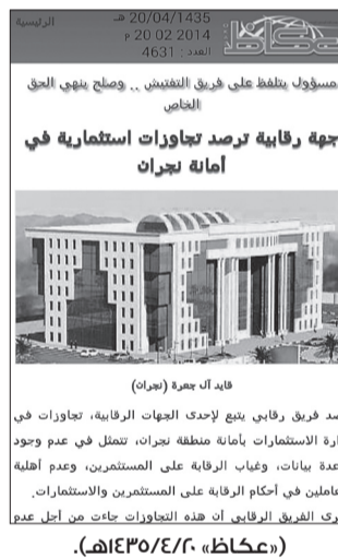
قائد آل بجرة (مركز)

للهجوم حاد من مدير إدارة الاستثمار في الأمانة، حيث تم الاستماع لمعاناتهم وعدم تمكنهم من أداء دورهم الرقابي على أعمال أمانة المنطقة. وكانت «عكاظ» قد نشرت معلومات عن رصد فريق رقابي يتبع لإحدى الجهات الرقابية، تجاوزات في إدارة الاستثمارات بأمانة منطقة جازان، تتمثل في عدم وجود قاعدة بيانات، وغياب الرقابة على المستثمرين، وعدم أهلية العاملين في أحكام الرقابة على المستثمرين، والتي عزها الفريق الرقابي إلى محاولات مسؤولي إدارة الاستثمار في عدم الكشف عن المحسوبة في تحريسية بعض المواقع الاستثمارية، وتضليل صغار المستثمرين من خلال إخفاء البيانات التي تضمن أن تكون هذه المواقع متاحة لمن تطبق عليهم الشروط، إضافة إلى اعتراض الفريق وعدم تمكنه من أداء واجباته، وتجاوز ذلك إلى تهديدهم والتلفظ عليهم بعبارات جارحة وغير لائقة.