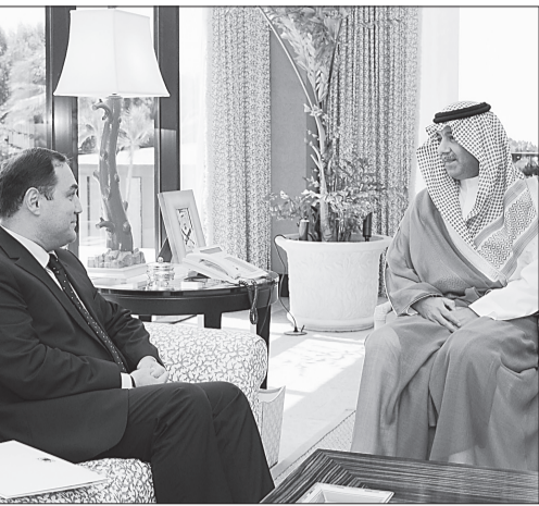
الأمير عبدالعزيز بن عبدالله مستقبلاً السفير جورج جانجفا.