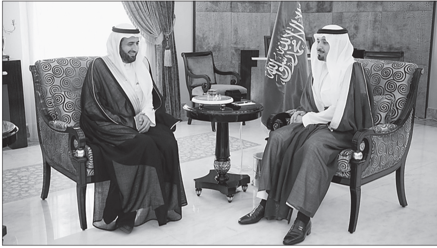
الأمير مشعل بن عبدالله مستقبلاً وزير التجارة.

جاء ذلك خلال استقبال سموه في مكتبه بجدة أمس محافظ الهيئة المهندس عبدالله بن عبدالعزيز الضراب الذي أطلعته على الجهود التي تبذل في توفير البنية التحتية لخدمات الاتصالات في منطقة الحرم والمشاعر المقدسة، واستعدادات الشركات لخدمة ضيوف الرحمن وتوفير أفضل خدمات الاتصالات لهم وشرح خطط الطوارئ التي يتم استخدامها عند وقوع أي خطر من قبل الهيئة والشركات. كما قدم المحافظ تقريراً لسموه عن الزيارة الميدانية التي قام بها مؤخرًا