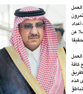
الأمير محمد بن نايف

وشدد على مضاعفة ساعات العمل في كافة المراكز قائلا: «نحن مستمرين في العمل ليلاً ونهاراً مع تكثيف أعداد القوى البشرية العاملة، فضلاً عن زيادة ساعات العمل، وذلك تحقيقاً وإنفاذاً للتوجيه الكريم». وأوضح اللواء يحيى أن العمل يجري وفق منظومة متكاملة مع كافة القطاعات الأمنية المختصة قفريق عمل واحد، وأن الجوازات كإحدى هذه الجهات تؤدي واجبها دون أي تباطؤ تجاه تصحيح الوضع الراهن حسب التوجيهات الصادرة من ولاة الأمر.