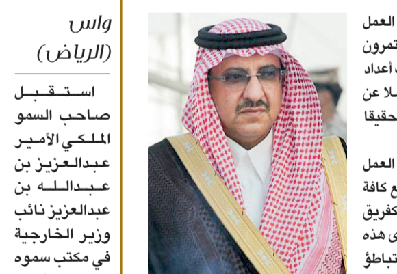
الأمير محمد بن نايف

استقبل صاحب السمو الملكي الأمير عبدالعزيز بن عبدالله بن عبدالعزيز نائب وزير الخارجية في مكتب سموه بالوزارة أمس معالي الأمين العام لمنظمة التعاون الإسلامي الأستاذ إبياد بن أمين مدني، الذي تقلد مهامه أميناً عاماً للمنظمة. وحضر اللقاء مدير الإدارة الإسلامية بوزارة الخارجية عدنان بغداداي.