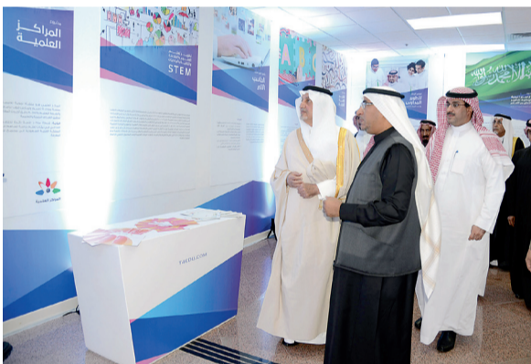
وخلال جولته في معرض المشروع