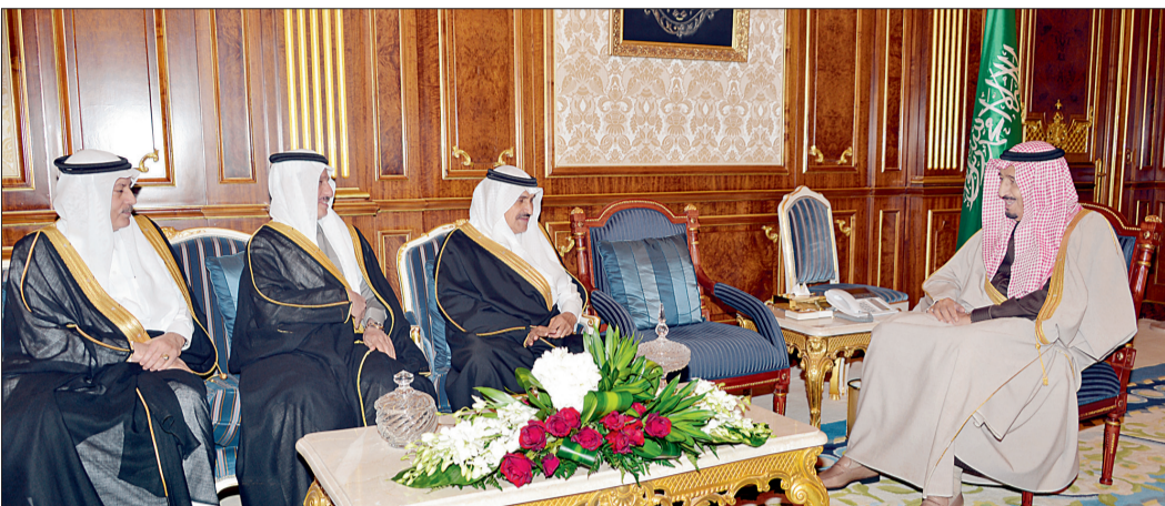
الأمير سلمان مستقبلاً السفراء المعينين لدى ٧ دول أمس في الرياض. (واس)