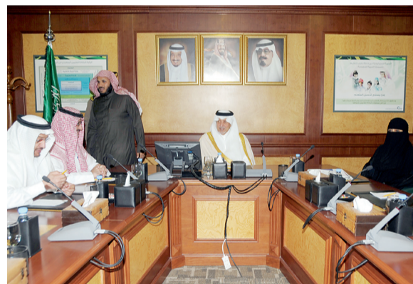
الأمير خالد الفيصل مجتمعاً بالقائمين على مشروع (تطوير).

معرض مصغر معد في مقر إدارة المشروع يعرض كافة البرامج والمشاريع التي تم ويتم تنفيذها في الميدان التربوي.