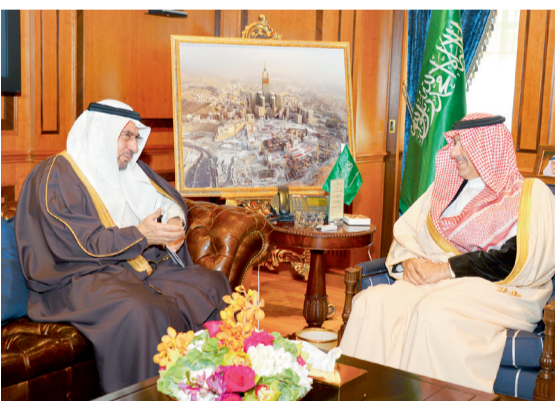
الأمير عبد العزيز بن عبدالله لدى استقباله إبياد مدني