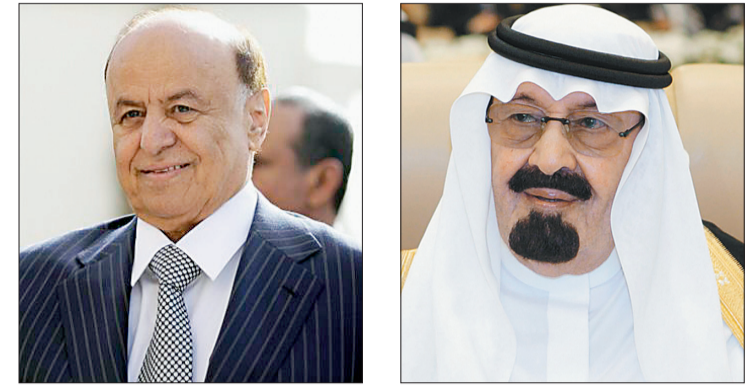
عبد ربه منصور هادي الملك عبدالله بن عبدالعزيز

اطلع صاحب السمو الملكي الأمير خالد الفيصل وزير التربية والتعليم على سير العمل في مشروع الملك عبدالله بن عبدالعزيز لتطوير التعليم خلال زيارة قام بها صباح أمس لمقر المشروع بالرياض. واجتمع سموه على مدى ثلاث ساعات ونصف الساعة مع المدير التنفيذي لشركة تطوير التعليم الدكتور علي الحكمي ومع قيادات الشركة ومديريها التنفيذيين، حيث استمع سموه لشرح مفصل عن سير العمل وما تحقق من إنجازات في المشروع وما يتم تنفيذه من البرامج والمشاريع التطويرية في الميدان التربوي تحت