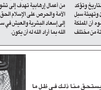
الأمير تركي بن عبدالله

والمضي قدما بعزيمة وإرادة قوية وإيمان راسخ بالأهداف السامية النبيلة في بناء المستقبل، مستلحين بالمعقيدة السلمية والولاء لولاة الأمر الكرام فلا مكان بينهم للغلو أو التطرف ولا مجال للجهل أو الكسل مدركين ما يحكيه الحاسنون الحاقدون على مقدساته والطامعون في خيرات، مستلهمين من الآباء والإجداد روح العطاء والإقدام