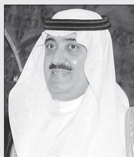
الأمير متعب بن عبدالله

وفهد) ورحمهم الله جميعا، وصولا إلى عهد خادم الحرمين الشريفين الملك عبدالله بن عبدالعزيز آل سعود حفظه الله. وقال إن ما تحقق لهذه البلاد المباركة وإنسانها يتطلب منا جميعا العمل على تعزيز أمنها وأمانها قولا وعملا، أفرادا ومؤسسات والدفاع عن مقدساتها وصيانة مقدراتها وحماية مكتسباتها، وعدم الانجراف خلف الشعارات الزائفة والتيارات الفكرية الهدامة. مشددا على أن مسؤولية المواطن تجاه وطنه عظيمة من أجل الحفاظ على أمنه واستقراره والوقوف في وجه كل من يحاول زرع الفتنة أو التأثير على أفكار شبابنا وتوجهاتهم بأي شكل كان. فشبابنا هم عماد الوطن وسواعد بنائه وركائز تنميته، وهم في الأساس نتاج فكر إسلامي معتدل ومجتمع يفخر بقيمه وأصالته.