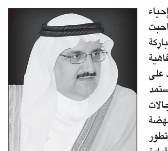
الأمير منصور بن متعب

قال الأمير الدكتور منصور بن متعب بن عبدالعزيز وزير الشؤون البلدية والقروية: إن إحياء ذكرى اليوم الوطني يستحضر القيم والمفاهيم والتضحيات والجهود المضنية التي صاحبت بناء هذه البلاد الغالية، لتعبر عما تكنه صدورنا من محبة وتقدير لهذه الأرض المباركة ولأبنائها المخلصين الذين كان لهم الفضل بعد الله تعالى في ما نتمتع به بلادنا من رفاهية واستقرار، فلم تتوقف مسيرة الخير والنماء ولله الحمد منذ أن جمع الله شمل هذه البلاد على يد المؤسس طيب الله ثراه والذي جعل من تاريخ هذا الوطن نموذجا للحكم والادارة استمد مبادئه وأسس من الشريعة الإسلامية وعمل على تنمية البلاد وتطويرها في مختلف المجالات وحمل من بعده أبنائه البررة الرسالة وتابِعوا المسيرة فساروا على نهجه، وشهدت البلاد نهضة تنموية متواصلة في مختلف المجالات إلى أن وصلت إلى ما هي عليه من تقدم ورفق وتطور شامل وخاصة في مجال العمل البلدي والذي كان ولا يزال يحظى بالاهتمام والدعم من القيادة الرشيدة مما مكّنه من القيام بأداء مهامه ومسؤولياته وتنفيذ استراتيجيته طويلة الأمد لتحقيق التنمية العمرانية في كافة مدن ومحافظات المملكة وشمولها بكافة الخدمات البلدية.