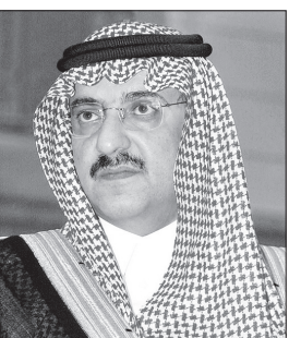
الأمير محمد بن نايف

والصحة والسكنية والمعيشية في مختلف مناطق ومحافظات المملكة. وكل ذلك في ظل مناخ آمن متميز تحقق بفضل الله ثم بفضل رعاية وتوجيه ودعم خادم الحرمين الشريفين لجهود أجهزة الأمن ورجاله المخلصين في كافة ميادين العمل الإنساني وتنمية قدراتهم وإمكاناتهم على نحو مكثف بعد توفيق الله من التصدي بكل شجاعة وقدره ومهارة للهجومات الإرهابية الشرسة التي تتعرض لها المملكة وتستهديهم وأمنها واستقرارها وتعطيل مسيرتها التنموية ودورها المؤثر إقليميا وعالميا واستطاعت المملكة بتوفيق الله ثم بالرعاية الكريمة من لدن خادم الحرمين الشريفين أن تقدم للعالم تجربة سعودية رائدة في مكافحة الإرهاب والإرهابيين هي محل إعجاب وتقدير الجميع واستفاد منها العديد من الدول في جهودها تجاه مكافحة الإرهاب والفكر المتطرف.