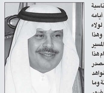
الأمير مشاري بن سعود

عبر الأمير مشاري بن سعود بن عبدالعزيز أمير منطقة الباحة عن مشاعره بهذه المناسبة قائلا: ونحن نحتفل بهذه الذكرى على نفوسنا جميعا، نسترجع صورة الماضي وقسوة أيامه ونستلهم من هذا الإرث الكبير ما تحقق لوطننا من رفاهية ورخاء ومكانة مستحقق لولاء الهمم الصادقة وعزيمة الرجال الأوفياء وتضحيات قادة هذا الوطن من أجل إنسانها. وهذا يستدعي منا استتعا مسؤولية قيمة هذا العطاء وأهمية المحافظة عليه ومواصلة درب المسير على خطى الأوتار، وتفويت الفرصة أمام أعداء النجاج والحاقدين الذين ما فتئوا منذ قيام هذا الكيان في حبك المؤامرات لعرقلة مسيرته المعطاءة، والأيام وحدها أثبتت أن المملكة هي مصدر الهمم لكل عطاء تنموي ورائدة لكل ما فيه عز الإسلام والمسلمين وداعية للسلام والشواهد والحقائق على الأرض والمخالف في أبلغ دليل. وأضاف: ولعلنا جميعا نرى المرحلة الراهنة وما يعصف بكثير من الدول المجاورة من فتن واضطرابات عطلت مسيرة الحياة وعكزت حضور الإنسان، والمملكة تسير بفضل الله ثم بقيادته الحكيمة ووعي مواطنيها بخطى سليمة إلى مدارج النور والأزهار، وقد تمت مشاريع الخير والبناء لك جزء من الوطن الحبيب.