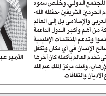
الأمير عبدالعزيز بن عبدالله

أكد الأمير عبدالعزيز بن عبدالله بن عبدالعزيز نائب وزير الخارجية، أن المملكة تسعى لإحلال الأمن والسلام الدوليين في العالم ليعم السلام والرخاء والعدل السامية التي قامت عليها وانطلقت منها سياساتها الخارجية، حيث حققت علاقات وطيدة بدول العالم لتكون علاقات تخدم مصلحة الإسلام والمسلمين، وأصبح لها الدور الريادي الإسلامي والسياسي والاقتصادي والاجتماعي والإنساني، لخدمة الإسلام والمسلمين في شتى بقاع الأرض، كما أصبحت مواقفها في الدفاع عن قضايا الأمة العربية والإسلامية في المحافل الدولية محل تقدير واهتمام، واستثمرت علاقاتها الطيبة مع الدول الصديقة المؤثرة لتحقيق أهداف سامية للأمتين العربية والإسلامية.