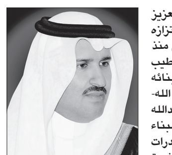
الأمير فيصل بن سلمان

عبر الأمير فيصل بن سلمان بن عبدالعزيز أمير منطقة المدينة المنورة عن فخره واعتزازه بما تحققت من إنجازات على مستوى الوطن منذ توحيد على يدي المؤسس الملك عبدالعزيز -طيب الله ثراه- وخلال فترات الحكم الزاهره لأبنائه الملوك سعود وفيصل وخالد وفهد -رحمهم الله- وحتى عهد خادم الحرمين الشريفين الملك عبدالله بن عبدالعزيز -حفظه الله- الذي قاد مسيرة البناء وفتح آفاقا جديدة لتنمية الوطن وبناء قدرات المواطنين، حيث حظيت منطقة المدينة المنورة بنصيبها من المشاريع التنموية الكبرى في إطار استراتيجية التنمية المتوازنة في جميع المناطق.