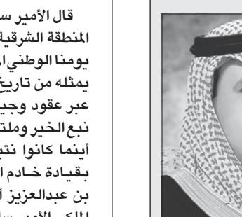
الأمير فهد بن بدر

شدد الأمير فهد بن بدر بن عبدالعزيز أمير منطقة الجوف على أن اليوم الوطني لا ينبغي أن يمر دون أن ندرك أنه إحياء لذكرى خالدة، هي ذكرى توحيد هذا الوطن الغالي على يد المغفور له الملك عبدالعزيز بن عبدالرحمن آل سعود -رحمه الله- حيث أصبح هذا الوطن المرآة التي انعكس فيها كل ما فيه من خير وأمن واستقرار. وقال: إن من أعظم النعم التي نلتها بلادنا نعمة التوحيد وإخلاص العباد لله عز وجل، مبينا أنه من فقد النعمة خرج عن جادة الدين ودخل في مناهة الانحراف الفكري، وهو ما انتهى بأصحابه إلى الإرهاب في الداخل والخارج، وتأكيدا لذلك فقد أسس خادم الحرمين الشريفين -حفظه الله- مبدأ الحوار مع اتباع الديانات الأخرى ونشر منهج التسامح وقبول الآخر.