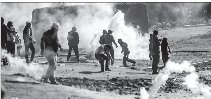
مواجهات بين الأمن التركي والأكراد قرب معسكر للاجئين السوريين على الحدود.

قتل ٤٢ شخصاً على الأقل بينهم ١٦ طفلاً في غارات جوية شنها طيران نظام بشار في ريف محافظة إدلب (غرب)، على ما أعلن المرصد السوري لحقوق الإنسان أمس. وأوضح المرصد، أن الغارات أوقعت ١٩ قتيلاً بينهم ستة أطفال قرب مدينة سراقب، و٢٣ قتيلاً بينهم عشرة أطفال في بلدة احسم بجبل الزاوية. وتقع غالبية منطقة ريف إدلب تحت سيطرة المعارضة المسلحة باستثناء مركزها مدينة إدلب. واستهدفت الغارات منازل مواطنين في بلدة احسم وأطراف بلدة سراقب، المناطق التي يتواجد فيها مواطنون من البلدة نزحوا منها بعد عدة عمليات قصف لغوات النظام بالطائرات الحربية والبراميل المتفجرة على البلدة، حسب المرصد. من جهة ثانية، وصل أكثر من ١٣٠ الف لاجئ غالبيتهم من الأكراد إلى تركيا هربا من استهدافهم في شمال شرق سوريا، حيث يحاصر بلدة عين العرب الاستراتيجية. ودعا معارضون سوريون إلى تدخل الائتلاف الدولي بقيادة الولايات المتحدة والذي أعلن الرئيس الأمريكي باراك أوباما استعداده لشن غارات جوية ضد معازل التنظيم في سوريا.