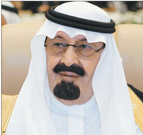
الملك عبدالله بن عبدالعزيز

أمر خادم الحرمين الشريفين الملك عبدالله بن عبدالعزيز آل سعود - حفظه الله - باستضافة (١٤٠٠) حاج من أكثر من (٧٠) دولة من مختلف قارات العالم لإداء فريضة حج هذا العام ١٤٣٥ هـ، ضمن برنامج الاستضافة الذي تشرف عليه سنويا وزارة الشؤون الإسلامية والأوقاف والدعوة والإرشاد. أعلن ذلك وزير الشؤون الإسلامية والأوقاف والدعوة والإرشاد المشرف العام على برنامج ضيوف خادم الحرمين الشريفين الملك عبدالله بن عبدالعزيز آل سعود للحج الشيخ صالح بن عبدالعزيز آل الشيخ.