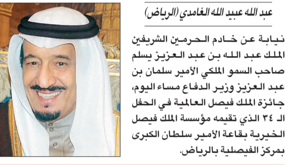
تفاصيل صفحة ٢٣