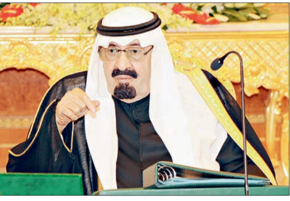
○ خادم الحرمين مترئسا جلسة مجلس الوزراء أمس. ○