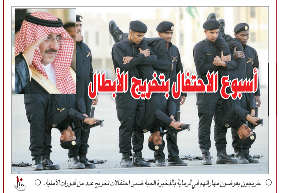
○ خريجون يعرضون مهاراتهم في الرماية بالذخيرة الحية ضمن احتفالات تخريج عدد من الدورات الأمنية.