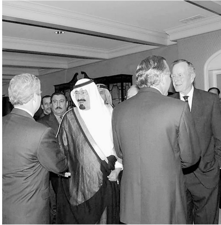
الرئيس الامريكى الاسبق جورج بوش يقيم حفل عشاء تكريما لسمو ولي العهد