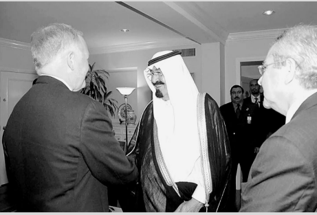
سمو ولي العهد يستقبل روي هنت

استقبل صاحب سمو الملكي الأمير عبدالله بن عبدالعزيز ولي العهد نائب رئيس مجلس الوزراء رئيس الحرس الوطني في مقر إقامته في مدينة