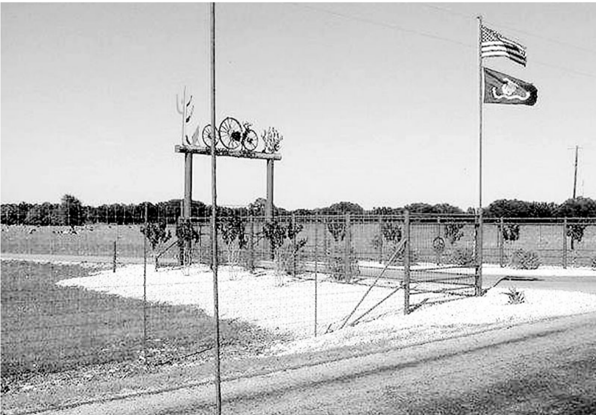
كروفورد مستعدة لاستقبال الامير عبدالله

كروفورد.. مركز صناعة القرار الأمريكي الجديد التي تبعد ١٢٠ ميلاً عن مدينة دلاس بولاية تكساس لها اسرارها ودها ليها واروتها الخاصة بها التي لم يتم الكشف عنها بعد كروفورد التي انشئت عام ١٨٦٧ والتي اصبح يطلق عليها سكانها دولة بوش Bush Country انتزعت من البيت الابيض الاستقبالات والمحادثات الرسمية التي كانت تعقد به لعدد من زعماء العالم. فالرئيس الأمريكي جورج بوش الذي اشترى مزرعة خاصة به في هذه المدينة الصغيرة عام ١٩٩٩ عندما كان يتقلد في تلك الفترة منصب حاكم ولاية تكساس بدأ بتقليد جديد باستضافة بعض زعماء العالم منذ فوزه في انتخابات الرئاسة الأمريكية الأولى واستمر في هذا التقليد حتى الان حيث يستضيف اليوم الاثنين بمزرعته الخاصة سمو ولي العهد الذي يزورها للمرة الثانية..