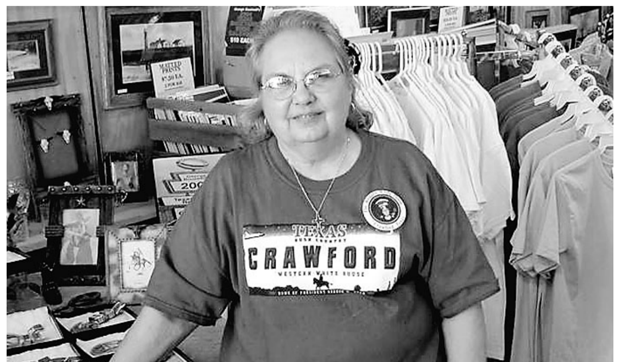
ريدين ديمونة: سعداء بزيارة ولي العهد

مشيرة الى ان مرضى كروفورد يذهبون للعلاج الى المدن القريبة منها. وحول ما تشتهر به هذه المدينة الصغيرة قالت ان اهم ما تشتهر به هو النوم مبكرا قائلة: "انه يجب الاتفاجا بانه ابتداء من العصر تبدو شوارع كروفورد خالية من السيارات والمارة ويخلد الجميع للنوم مبكرا بعد غروب الشمس". وأضافت ان كروفورد تشتهر بوجود فريق كرة القدم الذي تمكن من الفوز بالمرتبة الاولى لهذا العام في المنطقة. كما وتشتهر كروفورد ايضا بمنتزهها التاريخي الذي يعود تاريخه الى اصل سكانه من الهنود الحمر. وحول سبب انتشار المزارع في هذه المنطقة وتاريخ مزرعة الرئيس قالت ان مزارع ولا يمكن احصاء عددها. اما عن مزرعة الرئيس بوش فقالت انها تبعد عن المدينة ثمانية اميال ويقوم الرئيس عادة بزيارة المزرعة وقضاء معظم اجازاته بها. مشيرة الى ان الرئيس بوش قد اشترى المزرعة التي تبلغ مساحتها ١٦٧٥ هكتارا عندما كان حاكما لولاية تكساس. وكشفت ديمونة ان الرئيس بوش يقوم باعمال الفلاحة والزراعة بنفسه لانه يحب منذ صغره العمل الزراعي. وقالت ان منطقة كروفورد