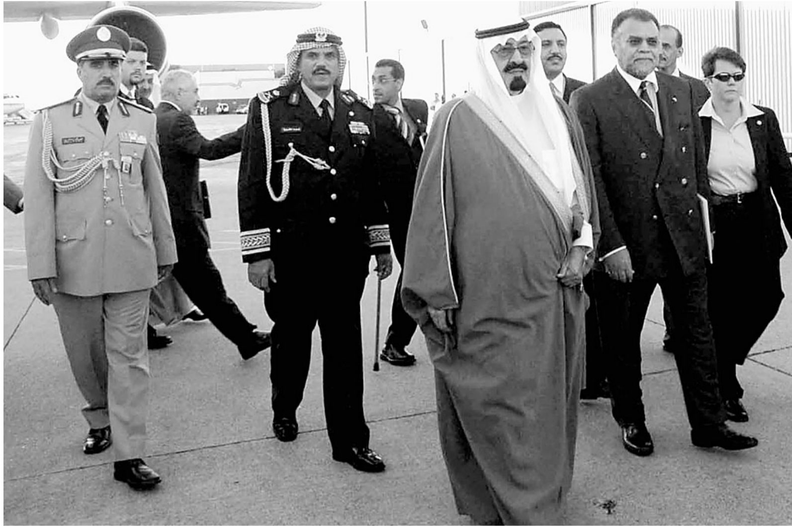
سمو ولي العهد يصل الولايات المتحدة الأمريكية

السؤال الذي يتبادر الى الذهن فور وصول بعثة «عكاظ» الى هناك مؤداه.. ماهي حكاية كروفورد ولماذا يستضيف فيها الرئيس بوش بعضاً من زعماء العالم دون غيرهم ولماذا أصبحت موضع اهتمام المراقبين الدوليين والتركيز من قبل الإعلاميين، ولماذا يقضى الرئيس معظم اجازاته هناك وكيف يقضيها. وتتولى «عكاظ» التي زارت هذه المدينة الصغيرة رواية قصة كروفورد من البداية وترصد طبيعة الحياة في هذه المدينة التي قد يفاجأ القارئ بأنه لا توجد بها أي مستشفيات اطلاقاً. وفي سلسلة من الحلقات تبدأ نشرها اعتباراً من اليوم التقت «عكاظ» مع عدد من مواطنيها وجست نبض الشارع حول زيارة سمو ولي العهد ورؤيتهم للمملكة ومستقبل السلام في المنطقة كما رصدت عادات وتقاليد سكان هذه المدينة وتاريخها وقصصها التي لم ترو بعد.