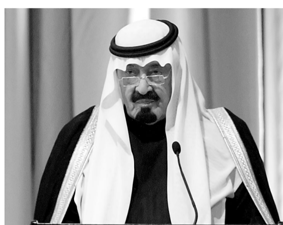
سموه خلال اللقاء الكلمة

بيئة جديدة ترحب بالاستثمار والمستثمرين وتقدم لهم كل رعاية.. واحب ان انتبه هذه الفرصة لأحكام على التوجه باستثماراتكم الى السوق السعودية الواسعة ذات الفرص الكبيرة والاحتمالات الواعدة.