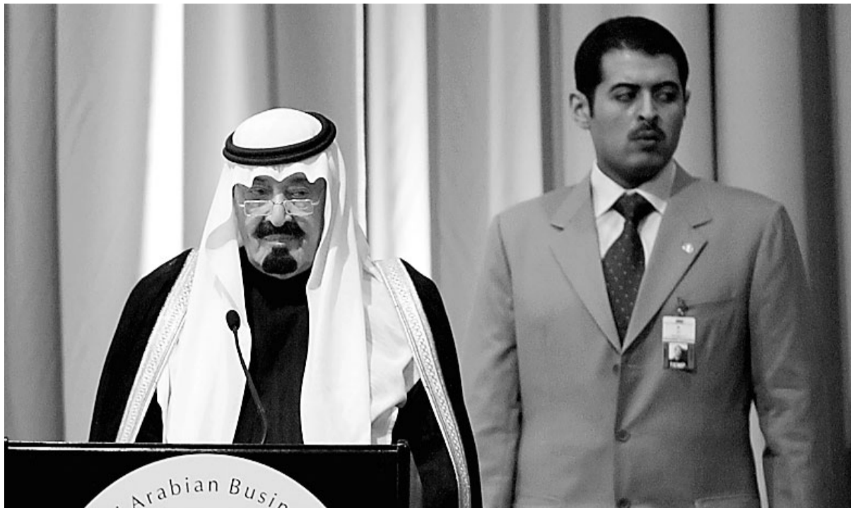
الامير عبدالله يتحدث خلال حفل عشاء اقامه على شرف سموه، المجلس الامريكى السعودى لاعمال في دالاس الليلة قبل الماضية