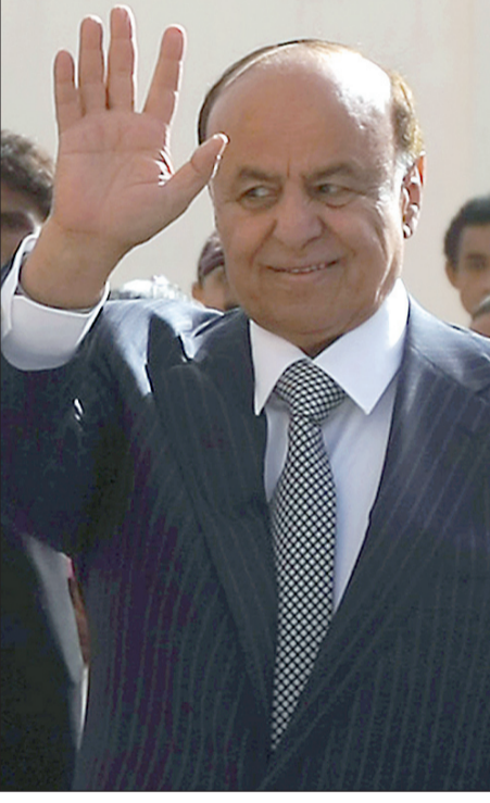
الرئيس عبدربه منصور هادي

كيف تعلقون على التغيير الذي حدث في صفوف الشباب الذين تلمسنا تأييدهم لفخامتكم ولكنهم في نفس الوقت يصرون على مواصلة احتجاجاتهم والبقاء في ساحات التغيير حتى تحقق كامل مطالبهم.. سؤالي هل هناك خطة للتعامل معهم إلى جانب الحوار؟ طبعاً.. طبعاً. الشباب هم من قادوا إرادة التغيير في اليمن، والشباب لهم كامل الحق وقد قدموا تضحيات جسيمة وعظيمة وبذلوا أرواحهم من أجل التغيير نحو الأفضل، وهم من أتى بالمبادرة الخليجية وقرار مجلس الأمن الدولي رقم ٢٠١٤ بصمودهم واعتصاماتهم ومسيراتهم، وهم في الواقع من يرسم المستقبل المرش، وقد ارتكز الهدف الأكبر للحوار الوطني الشامل بين كافة فئات ومكونات وعناصر المجتمع السياسية والثقافية والاجتماعية بمختلف عناوينها وفي المقدمة الشباب المتأثر بهدف إجراء معالجات وبرمجة الخطى معهم وبهم. على مختلف المسارات وبكل ما هو ممكن ولا شك أن الوطن بحاجة إلى طاقاتهم ومؤهلاتهم وسنعمل بكل ما هو ممكن لخلق الفرص وفتح الأبواب أمامهم - ونسال الله العلي القدير أن يمكننا من تحقيق هذا الإنجاز لهم، ونحن متفائلون ونعمل على وعيهم وإدراكهم لما عاناه ويعانيه الوطن والمناطق الأخرى.