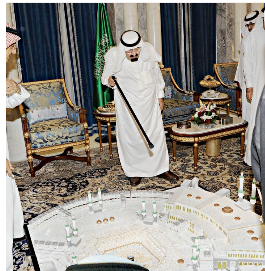
● يتابع مشاريع الحرمين الشريفين باهتمام شديد.. ومن كل المواقع.