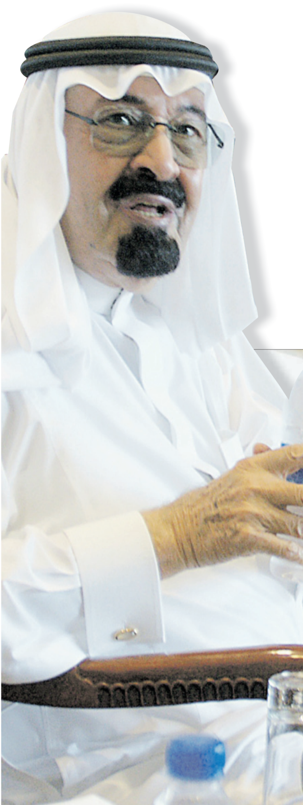
● الملك فرح بالإنجاز الكبير.. جامعة الملك عبدالله للعلوم والتقنية إثر زيارته لها.