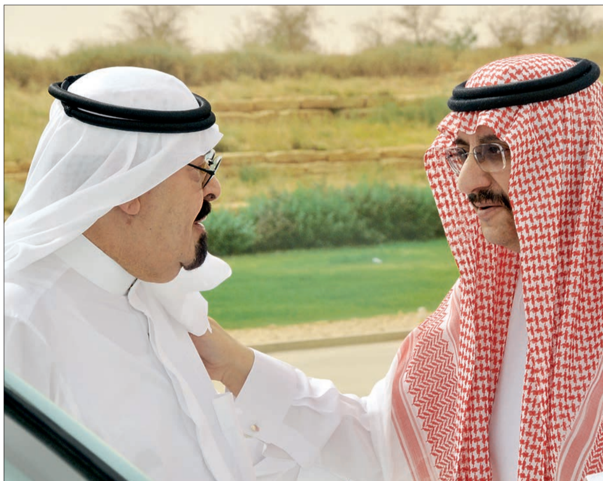
● يهنئ الأمير محمد بن نايف على سلامته.. ويشد من أزره.

● ليست هناك إزاعة أو فتاة محددة يحرص عليها، فهو متابع لجميع القنوات دون استثناء وإن كانت القنوات السعودية لها خصوصية لديه وهو علم ومتابع الكثير، كما يحرص من القضايا والبرامج بثرات الأخبار بإهتمام ويتحدث مع من حوله حول كل المستجدات في ما ينقلها التي يرى كيف يفكر الناس وكيف ينظرون إلى تلك الأحداث وكثيرا ما يبايننا براه مختلفة لا تلبث الأيام أن تؤكد صواب نظرة لها وتحليله لإبعادها.. كما يحرص على سماع ومشاهدة البرامج المحلية التي تعنى بالمواطن وهو مهوم، فهو حريص على معرفة كل كبيرة وصغيرة تتصل بأحوال الناس من خلال بعض البرامج التي تهتم بالشأن الداخلي والأمن، بما بالنسبة للصحف،