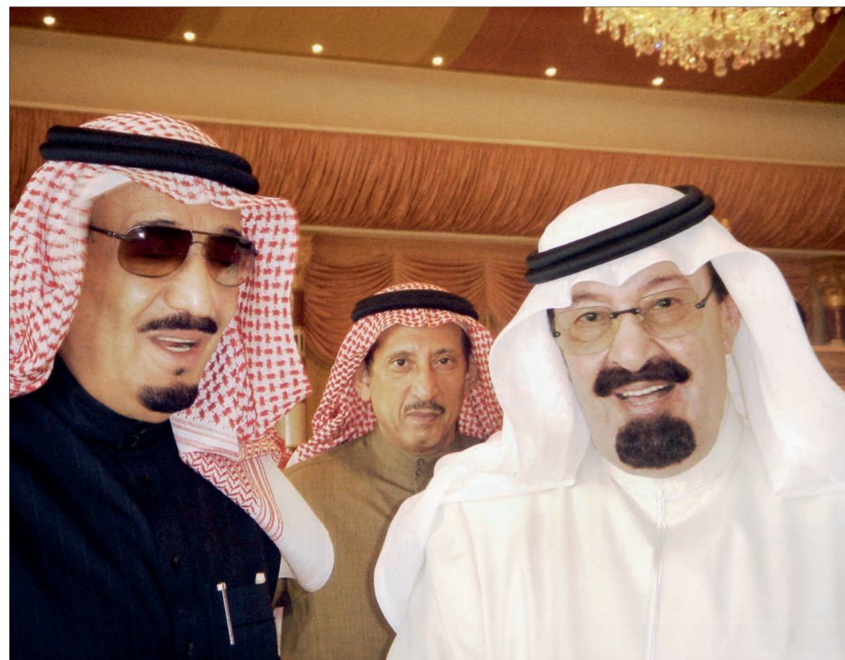
● حديث باسم بيته وبين ولي عهده الأمير سلمان.