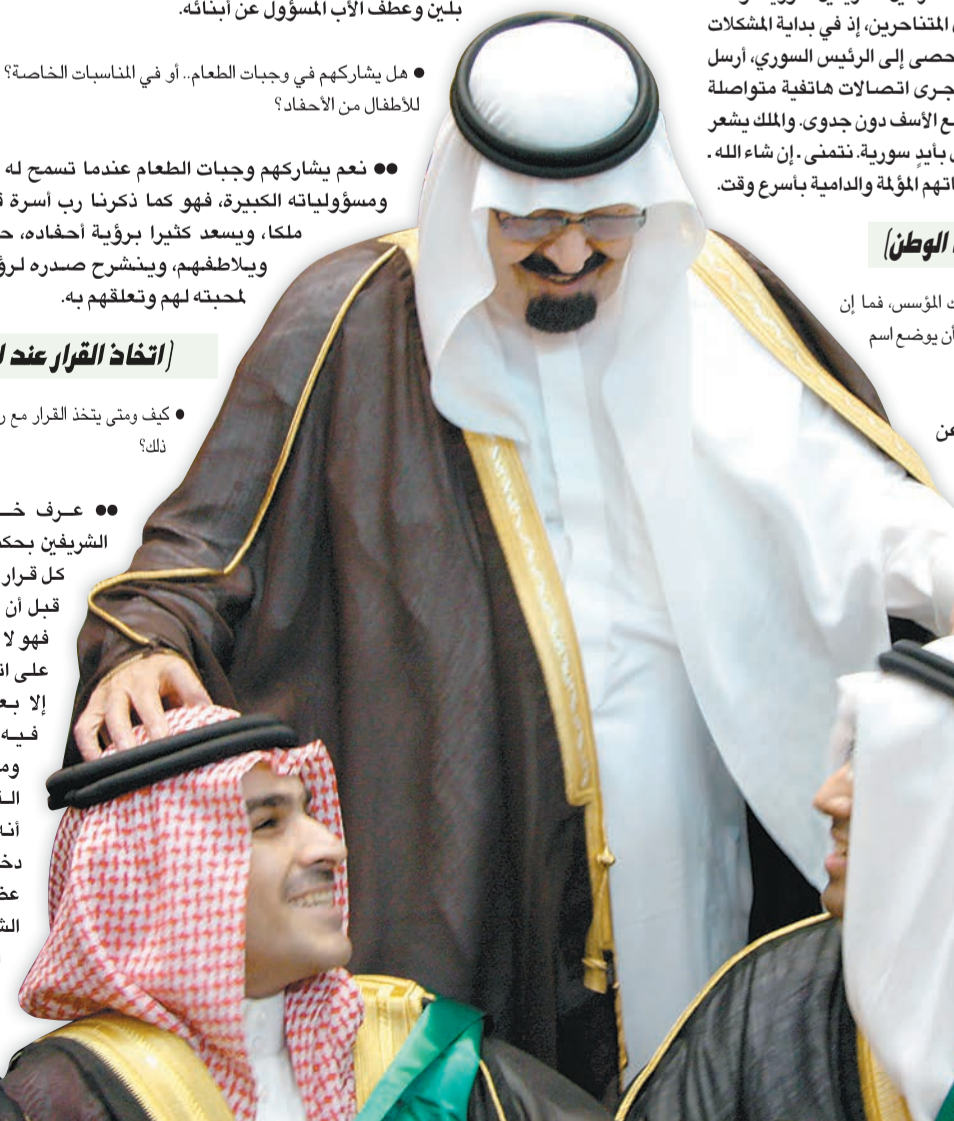
● سعيد شباب المستقبل.. وحريص على تحقيق آمانيهم وتطلعاتهم.

● هذا امر طبيعي.. اليوم ونحن نتكلم عن الملك عبدالعزيز فإنه تخصص ذلك في القول إنه مؤسس، فكل ما تراه وشاهده اليوم في المملكة من أمن واستقرار وبعد أن كانت القبائل متناحرة ومناحرة.. فكانت ترك مدى عطف جده التأسيس لهذا الكيان.. إذ لم يكن من عطف جده التأسيس لهذا الكيان.. إذ لم يكن من السهل أن يأتي شخص واحد ويجمعهم كهم على قلب رجل واحد. والمسلكت عضوية مجلس الشورى استشار العلماء في ذلك، وفيها توسعة المسعى.. وهكذا فسي جميع