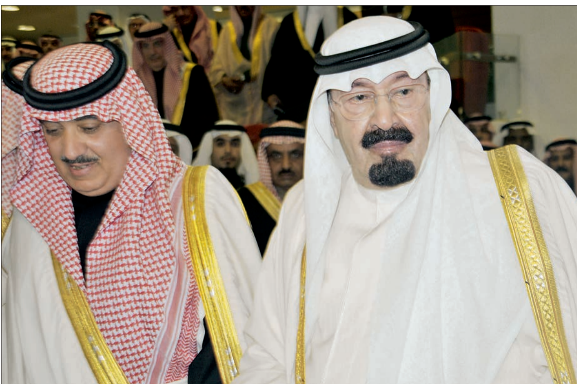
● الأمير متعب يرافق الملك في إحدى المناسبات.

فكل الصحف تحظى بنفس القدر من الاهتمام والتابعية وهو يتابع ما ينشر فيها من تحقيقات ومقالات دون تفرقة بين الصحف، ولكن الصحفية لا يشر فيها على معلومات وحقائق، وتخييراً ما كنا نسمع منه في لقاءاته بالصحفيين وهو يريد عليهم المصداقية. ولا سيما في رحلاته الخارجية التي يجمعه برؤساء التحرير، لأنه يؤمن بحرية الرأي الممتز والموضوعي، ويعتد الإثارة المفتعلة التي لا تخدم القارئ أو الصحفية.