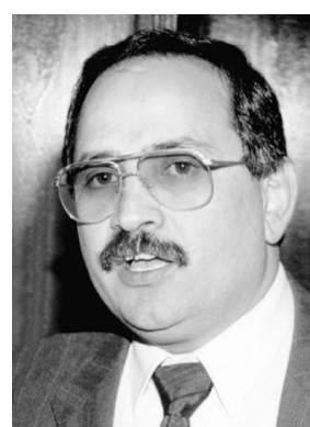
د. عدنان برجعي

عميقة ودائمة ولا شك ان الامير عبدالله بمقامه ودور المملكة ونقلها ومصداقيتها فهو الاقدر على اجراء وقفة مفصلية بين امريكا من جهة والدولة العربية من جهة ثانية، فكانت مواضع فلسطين والعراق ولبنان تقف كلها وقفة مفصلية ولا بد من قرارات دولية هامة فيها بما يتفق مع مقام الامير عبدالله والموعول عليه في مثل هذه المرحلة وايضا مصداقيته ومعرفته بمواقفه الراضية والى تقوم به المملكة به سواء في فلسطين او في العراق او في لبنان. هذه الموضوعات الثلاثة التي تتنازع بين المازق والحل، بين المنكسة والخطوة الواثقة الى الامام".