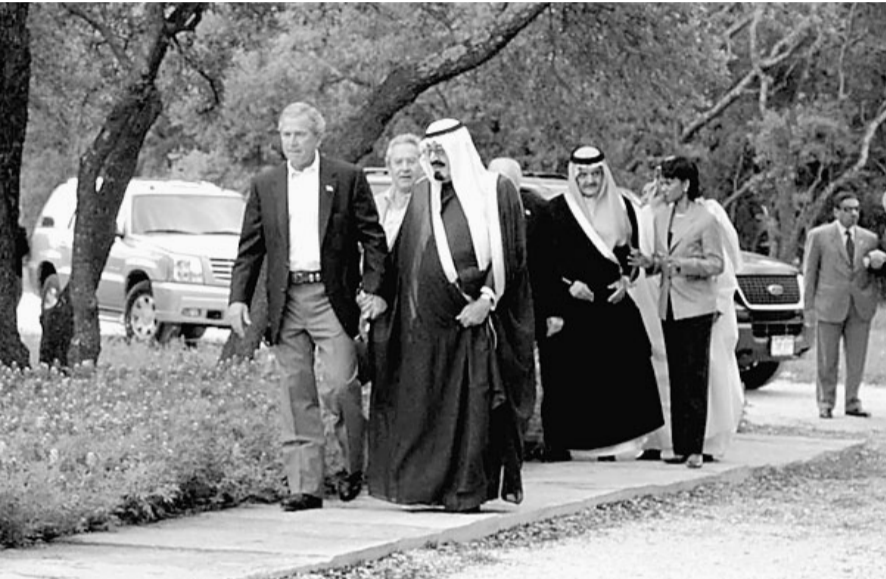
ولي العهد والرئيس بوش يدا بيد