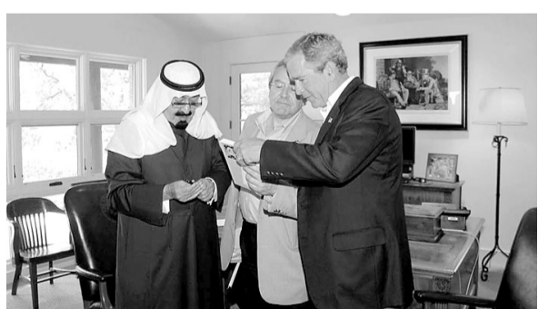
مرحلة جديدة بين الرياض وواشنطن

خبراء العلاقات الدولية في الدول العربية ثمنوا النتائج التي تمخضت عنها زيارة الامير عبد الله لأمريكا ولقاؤه مع الرئيس بوش في القاهرة قال د. سيد والي استاذ العلوم السياسية بالجامعة الامريكية ان تلك الزيارة اعادت الثقة الى العلاقات السعودية الامريكية وضعت اساساً جديداً للعلاقات العربية الامريكية و اشار في ذلك الى تأكيد البيان الختامي على عدم تدخل الولايات المتحدة الامريكية لفرض نمط معين على المسؤولين السعوديين وبهذا تضع هذه الزيارة و هذا البيان اساساً مهما في العلاقات العربية الامريكية يقوم على احترام الآخر وعدم التدخل في الشؤون الداخلية للآخر ويضيف د. والي الى ان سمو الامير عبد الله استطاع ان يقنع الرئيس بوش بأن الإصلاحات في العالم العربي يجب ان تتبع من الداخل وبالترتيب والدليل على ذلك هو ترحيب الولايات المتحدة بالاصلاحيات التي قامت بها المملكة والبرنامج المعطل في هذا الصدد وكذلك اشادة الولايات المتحدة بالانتخابات البلدية التي تمت في السعودية وقال د. والي ان شأن هذه الزيارة ان تساعد الولايات المتحدة على تفهم وجهة النظر العربية حول الصراع العربي الاسرائيلي وان