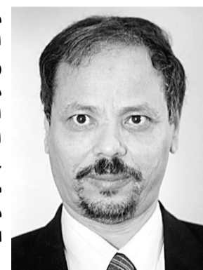
احمد بن حلي

اجمع مسئولون عرب في القاهرة على ان جولة سمو ولي العهد الامير عبد الله بن عبدالعزيز في بعض من الدول العربية ومنها مصر هدفا دعم العمل العربي المشترك ووضع رؤية عربية جماعية لمواجهة التحديات الراهنة و قال د. حسن ناعفة استاذ العلوم السياسية بجامعة القاهرة ان اي نظام اقليمي عربي سوف يكون في منتهى الضعف بدون التنسيق السوري المصري السعودي و اضاف انه كلما كان التنسيق بين هذه البلدان الثلاثة على مستوى عال كان الاء العربي الاقليمي اكثر قوة و قدرة على التعامل مع معطيات الاحداث المختلفة في المنطقة و اضاف ان احد اضلاع المثلث و هي سوريا تتعرض لضغوط هائلة حتى بعد انسحابها من لبنان و يشرح ذلك بقوله ان القرار ١٥٥٩ خرج بتوافق نادر بين فرنسا و الولايات المتحدة في مجلس الامن و زيارة الامير عبد الله الى واشنطن و قبلها الى باريس هدفا فصل الرؤية الفرنسية عن الرؤية الامريكية تجاه سوريا في هذا التوقيت لان امريكا و معها اسرائيل تريد الذهاب بالقرار ١٥٥٩ الى ابعد بكثير من الخروج السوري من لبنان و تتعدى ذلك الى التدخل في الشؤون الداخلية اللبنانية و بترع سلاح حزب الله والفصائل الفلسطينية في الجنوب لكن الموقف الفرنسي تريد السعودية منه ان يتكثف بالانسحاب من لبنان لذلك يسعى سمو ولي العهد من خلال لقائه مع الرئيس مبارك وبعدها مع الرئيس السوري دفع سوريا لانتخاذ اجراءات تصعبها من اي مخططات يدبر لها الغرب ، و اشار د. ناعفة الى ان