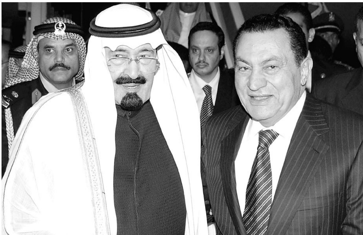
ولي العهد والرئيس مبارك خلال قمة شرم الشيخ

ناجحة. وأكد أن نقل وجهات النظر العربية الى واشنطن يعد إنجازا في حد ذاته ونجاحا كبيرا بكل المقاييس خاصة أن أمريكا في حاجة الى المملكة العربية التي واشتغل بعد الرؤية التي طرحها الرئيس جورج بوش في ٢٠٠٢ بأقامة دولتين فلسطينية وإسرائيلية.