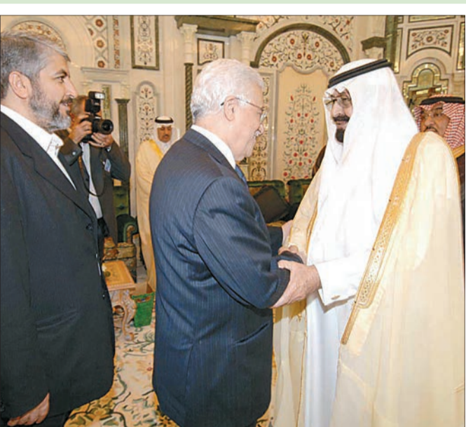
خادم الحرمين الشريفين لدى استقباله المسؤولين الفلسطينيين