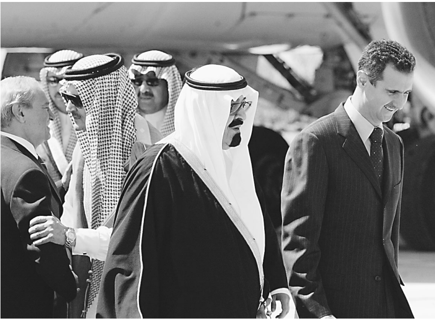
ولي العهد والرئيس الأسد في مطار دمشق الدولي

مطار دمشق الدولي متوجها الى المملكة الاردنية الهاشمية الشقيقة. وكان في وداع سموه في المطار أخوه فخامة الرئيس الدكتور بشار الأسد رئيس الجمهورية العربية السورية ومعالي وزير الخارجية فاروق الشرع وسفير سوريا لدى المملكة الدكتور أحمد نظام الدين والقائم بالاعمال في سفارة خادم الحرمين الشريفين لدى سوريا وسعود عبد الله كاتب وأعضاء السفارة. وقد غادر في معية سمو ولي العهد أعضاء الوفد الرسمي المرافق. حفظ الله سمو ولي العهد في سفره واقامته.