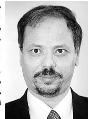
احمد بن حلي

اجمع مسئولون عرب في القاهرة على ان جولة سمو ولي العهد الامير عبد الله بن عبدالعزيز في بعض من الدول العربية ومنها مصر هدفا دعم العمل العربي المشترك ووضع رؤية عربية جماعية لمواجهة التحديات الراهنة و قال د. حسن ناعفة استاذ العلوم السياسية بجامعة القاهرة ان اي نظام اقليمي عربي سوف يكون في منتهى الضعف بدون التنسيق السوري المصري السعودي و اضاف انه كلما كان التنسيق بين هذه البلدان الثلاثة على مستوى عال كان الاء العربي الاقليمي اكثر قوة و قدرة على التعامل مع معطيات الاحداث المختلفة في المنطقة و اضاف ان احد اضلاع المثلث و هي سوريا تتعرض لضغوط هائلة حتى بعد انسحابها من لبنان و يشرح ذلك بقوله ان القرار ١٥٥٩ خرج بتوافق نادر بين فرنسا و الولايات المتحدة في مجلس الامن و زيارة الامير عبد الله الى واشنطن و قبلها الى باريس هدفا فصل الرؤية الفرنسية عن الرؤية الامريكية تجاه سوريا في هذا التوقيت لان امريكا و معها اسرائيل تريد الذهاب بالقرار ١٥٥٩ الى ابعد بكثير من الخروج السوري من لبنان و تتعدى ذلك الى التدخل في الشؤون الداخلية اللبنانية و بترع سلاح حزب الله والفصائل الفلسطينية في الجنوب لكن الموقف الفرنسي تريد السعودية منه ان يكتفي بالانسحاب من لبنان لذلك يسعى سمو ولي العهد من خلال لقائه مع الرئيس مبارك وبعدها مع الرئيس السوري دفع سوريا لانتخاذ اجراءات تضمنها من اي مخطلطات يدبر لها الغرب ، و اشار د. ناعفة الى ان