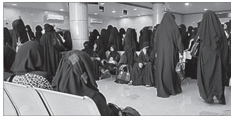
برامج مساندة للضمان وإعانات ثابتة.

موافقة خادم الحرمين الشريفين على دعم بنود الجمعيات الخيرية والتعاونية ودعم الصندوق الخيري الاجتماعي، وكذلك زيادة المخصصات المقدمة للأسر البديلة التي ترعى الأيتام من ذوي الظروف الخاصة ومن في حكمهم، إضافة إلى إتباع عدد من أبنائنا الأيتام الذين ترعاهم الوزارة بالتعاون والتنسيق مع وزارة التعليم العالي. وأضاف: شهدت فروع الوزارة توسعا كميًا وتطورًا نوعيًا في فروعها وخدماتها التي تقدم من خلالها عبر كافة قطاعاتها في ميادين عملها المختلفة، فقد بلغ عدد مكاتب الضمان الاجتماعية ووحدة ضمانية، وبلغ عدد الجمعيات الخيرية المرخص لها (٦٠٣) جمعيات خيرية، إضافة إلى (٨٩) مؤسسة خيرية خاصة، وعدد الجمعيات التعاونية بلغ (١٦٣) جمعية تعاونية ما بين متعددة الأغراض ومتخصصة، في حين بلغ عدد لجان التنمية الاجتماعية الأهلية (٣٣٦) لجنة في مختلف مناطق المملكة، أما فروع الرعاية والتنمية الاجتماعية التي تقدم خدماتها لفئات متعددة كالأيتام والمعوقين والمسنين والأحداث وغيرهم، فقد شهدت في عهد خادم الحرمين الشريفين - حفظه الله - توسعا كبيرا ليصل إجمالي عدد الفروع التابعة لوكالة الوزارة للرعاية والتنمية الاجتماعية إلى ما يزيد على (١٥٥) فرعاً ما بين فروع إقليمية وتاهيلية ورعاية وخدمية.