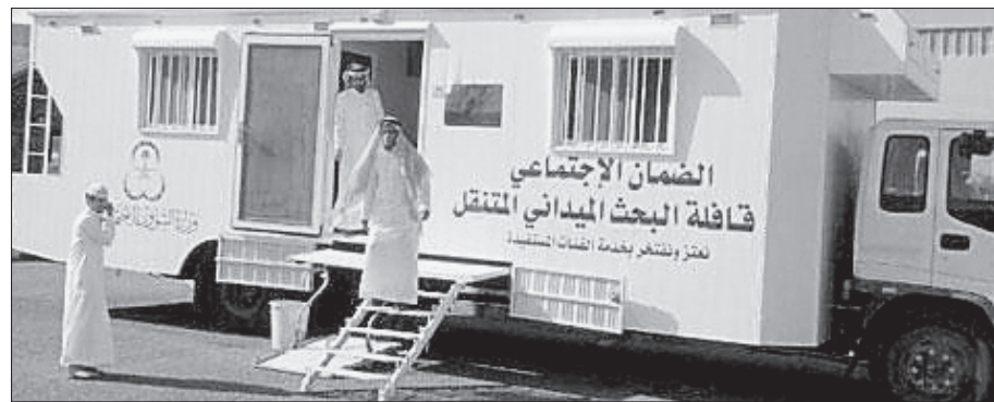
البحث عن المحتاجين عبر قوافل متنقلة.