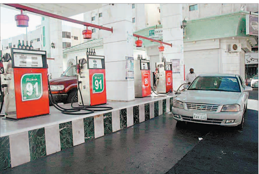
تعبئة إحدى السيارات بالبنزين الجديد

لو تعطل حاج او فاتته الرحلة ولو تخلف حاج ومن غير سبب فعله يبقى الخلل موجود مو في الحج من أصله هنية يخلق شعره بعد ادائه الحج