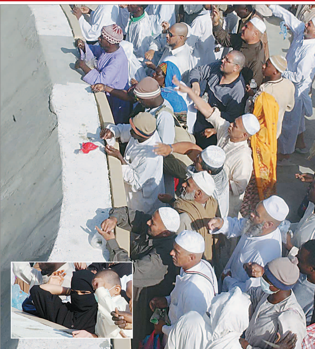
ضيوف الرحمن رموا الجمرات بسهولة وبسر وفي الاطراف حافة وطفلهما خلال الرمي