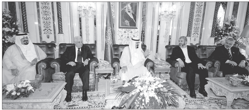
الملك لدى استقباله القادة الفلسطينيين بحضور سمو ولي العهد

استقبل خادم الحرمين الشريفين الملك عبدالله بن عبدالعزيز آل سعود حفظه الله في قصر الصفا بمكة المكرمة أمس فخامة رئيس السلطة الوطنية الفلسطينية محمود عباس ورئيس المكتب السياسي لحركة حماس خالد مشعل ودولة رئيس الوزراء الفلسطيني إسماعيل هنية وعدد من المسؤولين في حركتي فتح وحماس. وقد أقام خادم الحرمين الشريفين أيده الله مأدبة غداء تكريماً لاشاقته قادة