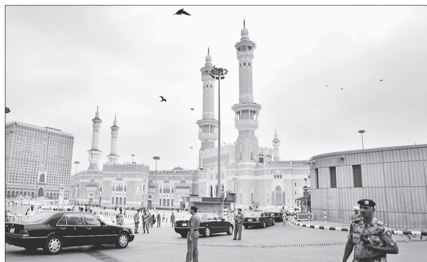
حمام السلام برفرف على مأذن الحرم الذي يحتضن الحوار الفلسطيني

ومن أجل أسرتنا وأسرانا الذين ينظفون إلى وحدتنا وإلى إنطلاقة جديدة لمسيرة العمل الوطني ووفاء لدماء شهدائنا الذين غنوا هذا الطريق المبارك واختطلت دماؤهم الفتاوى والحماسية ومن أجل جرحنا ومعوقينا ومن أجل جماهير أمتنا العربية والإسلامية الذين تعتبر فلسطين والقدس والأقصى في قلوبهم وساءهم اختلافنا السياسي وساءهم اختلافنا في الميدان وما نرّف من دماء ماكان لها أن تنزف إلا في وجه العدو الصهيوني ، جننا من أجل قضية الأقصى والقدس التي اليوم كما ذكر أخي أبو مازن العدو الصهيوني يستغل ظروفنا كثيرة ويقدم بهذه الخطوات الاعترافية على مقدساتنا وعلى أرضنا المباركة ، جننا إلى هذا المكان المبارك من أجل أن يتفرغ الفلسطينيون وقادتهم وفصائلهم للملفات الكبيرة لاستعادة الأرض والحقوق وإقامة الدولة الفلسطينية ذات السيادة التي تجعلنا كل ملفاتها الأساسية في مواجهة الاستيطان والحدار وقضية القدس وحق العودة وتعزيز الجبهة الوطنية الداخلية، جننا إلى هذا المكان بدعوة كريمة من خادم الحرمين الشريفين الملك عبدالله بن عبد العزيز ودعا الله أن يجري خادم الحرمين الشريفين خير الجزاء على هذه الدعوة الكريمة للاتحاد. وقال جننا نتفق وليس أمامنا إلا أن نتفق تكفينا حرمة المكان فنحن على مشارف الكعبة المشرفة بعد أن أدبنا صلاة الظهر وحرمة الزمان فنحن في الأشهر الحرم متأثرين بحرمة الدماء ومتأثرين باستضافة الأشقاء وحرص شعبتنا وأمتنا وأنا