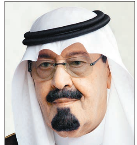
خادم الحرمين الشريفين