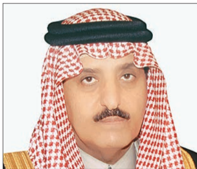
الأمير أحمد بن عبدالعزيز.

التي تولونها وولي عهدكم، حفظكم الله، لكافة مرافق خدمات الحجاج والتي من شأنها تهيئة سبل الراحة لضيوف الرحمن وتمكينهم من أداء الفريضة بسهولة وأمان». وأوضح سموه أن عدد الحجاج القادمين لهذا العام قد نقص عن العام الماضي بـ ٧٧٩٦٨ حاجا بنسبة قدرها ٤ ٪ تقريبا، وقال إن دخول حجاج هذا العام كان على النحو التالي : عن طريق الجو ١٦٢١٩٨٢ حاجا. عن طريق البر ١١٢٠٢٠ حاجا. عن طريق البحر ١٧٩٣٠ حاجا. وهم يمثلون ١٨٩ جنسية من مختلف أقطار العالم. ودعا سمو الأمير أحمد بن عبدالعزيز الله العلي القدير أن يحفظ خادم الحرمين الشريفين لهذه الأمة قائدا وبانيا لنهضتها وأن يحفظ ولي عهده الأمين ويدعم على هذه البلاد نعمة الأمان والإيمان. ■