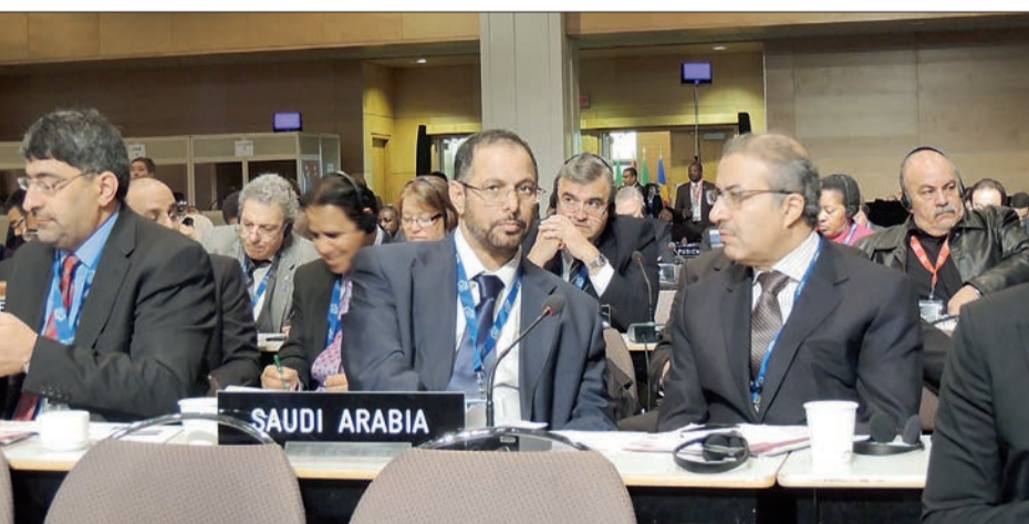
وفد الشورى يشارك في عمومية الاتحاد البرلماني الدولي.

وعبر عن تطلعه إلى أفاق جديدة من العلاقات والتعاون البنا بين مجلس الشورى ومجلس الشيوخ الكندي بما يخدم المصالح المشتركة للبلدين الصديقين. وكانت الدورة السابعة والعشرين بعد المائة للجمعية