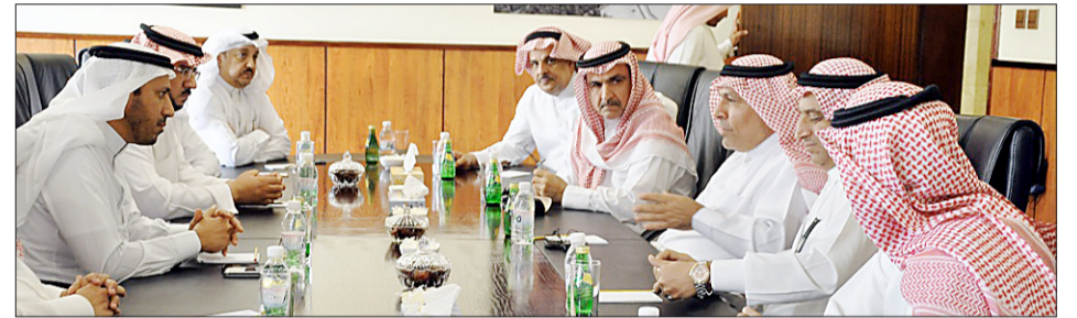
○ جانب من اجتماع رئيس غرفة الأحساء مع أعضاء المجالس الشبابية مؤخرًا. ○