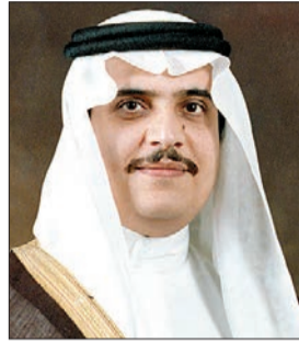
الأمير محمد بن فهد

برعاية صاحب السمو الملكي الأمير محمد بن فهد أمير المنطقة الشرقية والرئيس الفخري لمركز الملك فهد بن عبدالعزيز للجودة انطلقت أمس فعاليات «البيئة الإيجابية للجودة والتميز» الذي تنظمه الإدارة العامة للتربية والتعليم بالتعاون مع المجلس السعودي للجودة، وبمشاركة نخبة من المتحدثين، الذين يمثلون تعليم المنطقة والمجلس السعودي للجودة، إلى جانب عدة قطاعات حكومية وخاصة، ويأتي ذلك تزامناً مع فعاليات يوم الجودة الشاملة في التعليم. وأوضح مدير عام التربية والتعليم في المنطقة الشرقية الدكتور عبدالرحمن بن إبراهيم المديرس، في كلمته في حفل الافتتاح، أن المنتدى