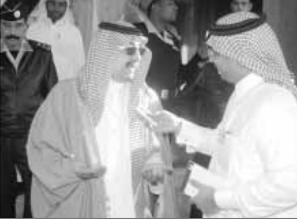
الأمير فيصل يتحدث للزميل خالد دراج

تفقد صاحب السمو الملكي الامير محمد بن سعود بن عبدالعزيز أمير منطقة الباحة أمس الاول محافظة المخاوة واستمع الى طلبات الاهالي واصدر تعليماته للجهات المختصة بسرعة الاستجابة وتذليل الصعوبات امام خدمات المواطنين. وشرف سموه الحفل الترحيبي الذي اقامه رؤساء المراكز تكريماً لسموه وذلك بحضور محافظ المخاوة درويش غرم الله الغامدي ومحافظ قلوة عبدالعزيز بن القفوس اللذين عبرا عن شكرهما لسموه على ما يوليه من اهتماما للمنطقة ومواطنيها.