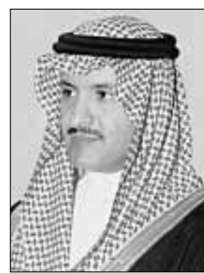
الأمير سلطان بن سلمان

عبدالله عبيدالله الغامدي - الرياض: تعقد الجمعية العمومية للجمعية السعودية للاطفال المعوقين اجتماعها برئاسة صاحب السمو الملكي الامير سلطان بن سلمان بن عبدالعزيز رئيس مجلس الادارة في الثالث والعشرين من شهر ربيع الثاني المقبل. ووضح مدير عام الجمعية عوض الغامدي ان الاجتماع سيقرر انتخاب مجلس ادارة جديد للدورة الجديدة للجمعية. من جانب آخر تعكف الامانة العامة لجائزة الجمعية على اعداد الترتيبات