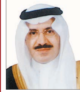
الأمير د. مشعل بن مساعد

رفع صاحب السمو الأمير الدكتور مشعل بن عبدالله بن مساعد المستشار بديوان سمو ولي العهد السهلي والتبريكات لخادم الحرمين الشريفين الملك عبدالله بن عبدالعزيز آل سعود، ولصاحب السمو الملكي الأمير سلمان بن عبدالعزيز آل سعود ولي العهد نائب رئيس مجلس الوزراء وزير الدفاع وللشعب السعودي على ما من الله به من نجاح العملية الجراحية التي أجريت لخادم الحرمين الشريفين وخروجه - حفظه الله - من المستشفى سالماً معافى. وقال سمو إن السعادة التي غمرت قلوبنا جميعاً بنجاح العملية الجراحية ومغادرة خادم الحرمين الشريفين مدينة الملك عبدالعزيز الطبية وهو بصحة وعافية تجسد عمق العلاقة بين القيادة والشعب وتؤكد على مكانته الكبيرة. ودعا سمو المستشار بديوان سمو ولي العهد له عز وجل أن يسبغ على خادم الحرمين الشريفين لباس الصحة والعافية، وأن يجعله ذخراً للإسلام والمسلمين ولهذا الوطن المعطاء.