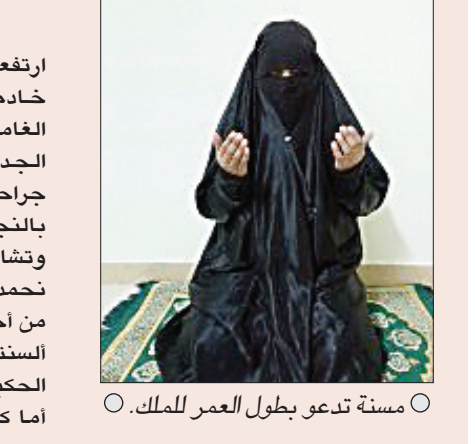
○ مسنة تدعو بطول العمر للملك. ○