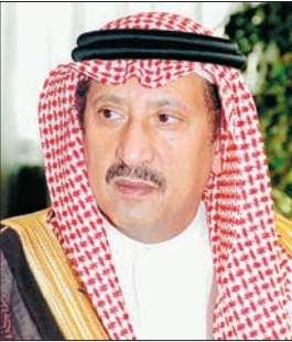
الأمير تركي بن ناصر

البحرين الشريفين عند أبناء شعبه الذين أحبوهم قانداً وأباً وأخاً وهنئاً له أبده الله هذه المكانة بين شعبه، كما سكن قلوب الأمتين العربية والإسلامية. وأضاف، «أن رؤية خادم الحرمين وهو بصحة وعافية مشاعر يعجز عن وصفها التعبير ليوصل مسيرته العظيمة في نهضة بلاده وإكمال تشييد صروح التنمية، والنهضة التي تعيشها المملكة في جميع الميادين نتيجة العمل الدؤوب والتخطيط السليم لرفعة الوطن ونمائه في المجالات البيئية والأرصادية والاقتصادية والتنموية والتعليمية والطبية والاجتماعية». ومضى قائلاً: إن أبناء الشعب السعودي والأمم العربية والإسلامية عبروا بصدق عن محبتهم لقائد الأمة خادم الحرمين الشريفين بأن يمن الله عليه بتمام الشفاء ويحفظه من كل مكروه، فهو قائد التطوير وقائد النهضة الكبيرة والمرشدة التي نقلت الوطن والمواطن لمصاف الدول الأولى في العالم في جميع المجالات.