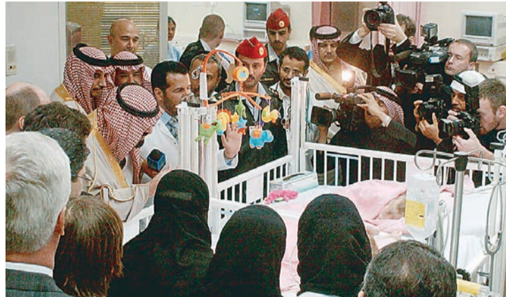
سمو ولي العهد خلال زيارته لجناح التوأمتين

هذه العملية الكبيرة. بعد ذلك زار سموه الكريم الطفلتين في العناية المركزية سائلاً الله سبحانه وتعالى ان ينعم عليهما بالصحة والعافية.