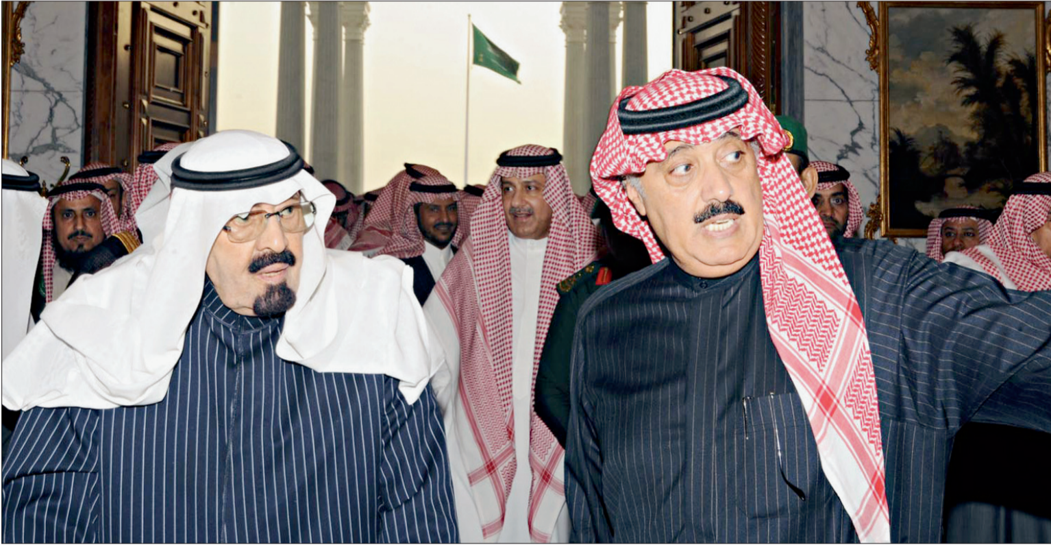
○ خادم الحرمين الشريفين لدى مغادرته المدينة الطبية ويبدو إلى جواره نجله الأميران متعب وعبدالعزیز.

بمناسبة مغادرة الملك المستشفى بعد شفائه (حفظه الله) ورفع كل من الشيخ مساعد بن سعد الحارثي، حسين بن عايض القرع الحارثي والشيخ خالد العليان أبو هندي، الأكف عالياً وقالوا «حمداً لله الذي من على ملك القلوب بالصحة والعافية» وأضافوا «اتفق الجميع الرجال والنساء والشباب على الدعاء لخادم الحرمين الشريفين - حفظه الله - بقلب صادق وتواصي المواطنون بينهم على ذلك لما تحمله قلوبهم من محبة وتقدير للملك عبدالله بن عبدالعزيز».