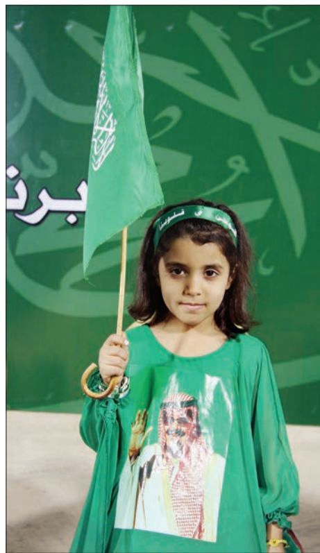
○ طفلة ترفع راية التوحيد وعلى صدرها الأب القائد.