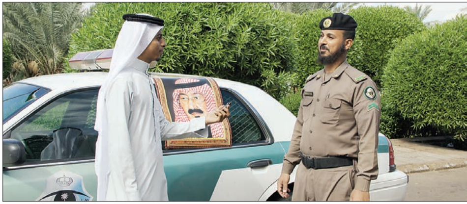
○ رجل مرور يتحدث لعكاظ في المدينة المنورة.