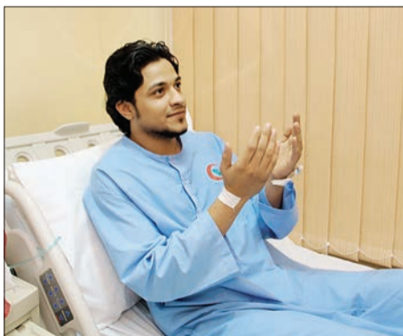
○ مريض على السرير الأبيض يدعو للملك.