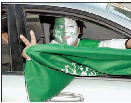
○ تعبير عن الفرحة بشفاء الملك.