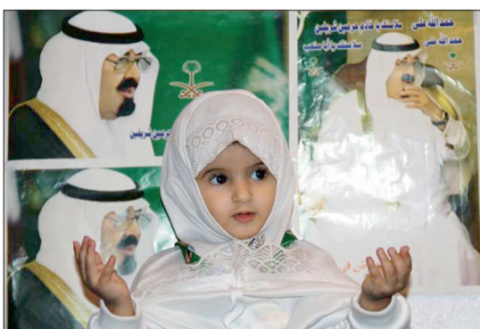
دعاء لقائد الأمة بالسلامة الدائمة.