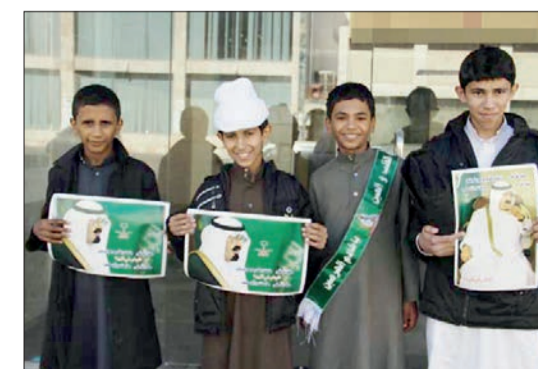
طلاب يحملون صور خادم الحرمين إتهاجاً بشفائه.