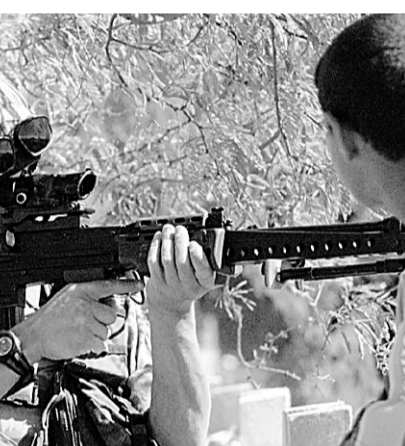
جندي بريطاني يصوب بندقية بجوار فتى عراقي في البصرة امس

ستعقد اول اجتماع لها اليوم الأربعاء.. ماذا يمثل لكم انعقادها باعتبارها اول برلمان عراقي منتخب بعد سقوط نظام صدام؟ * ليس هناك شك ان عقد اجتماع الجمعية العراقية يعتبر بكل المعايير يوما تاريخيا في حياة العراقيين وهذا اليوم هو تنويع لمرحلة ما بعد الانتخابات حيث سيجلس ٢٧٥ عضوا منتخبا في البرلمان العراقي الجديد، في يوم العراق الجديد، بعد ان وضع الشعب العراقي رقبته في جميع الاعضاء المنتخبين، ولهذا نحن نتطلع الى عهد جديد لعراق آمن.. وعلى هذه الجمعية مهام جسيمة.