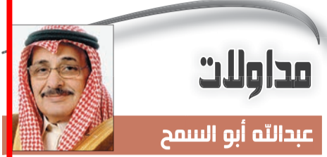
عبدالله أبو السمح

تنفيذاً لتوجيهات خادم الحرمين الشريفين الملك عبدالله بن عبدالعزيز آل سعود وصاحب السمو الملكي الأمير سلمان بن عبدالعزيز آل سعود ولي العهد نائب رئيس مجلس الوزراء وزير الدفاع، حفظهما الله، لجمع أجهزة الدولة بتسخير كامل إمكانياتها لتوفير أفضل السبل لراحة حجاج بيت الله الحرام، فقد أكملت وزارة الثقافة والإعلام استعداداتها لهذا الموسم الكريم.