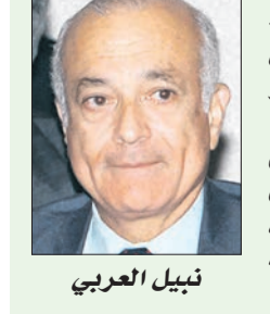
أحمد عبد الله «القاهرة» نعى الأمين العام لجامعة الدول العربية الدكتور نبيل العربي صاحب السمو الملكي الأمير سطان بن عبدالعزيز آل سعود أمير منطقة الرياض يرحمه الله.