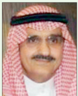
الأمير خالد بن بندر

الأمير خالد هو الابن الثالث من أبناء الأمير بندر بن عبدالعزيز آل سعود. بعد إكمال دراسته الثانوية التحق بالسلك العسكري. درس بالكلية العسكرية الأكاديمية البريطانية ساند هيرست. بعد تخرجه التحق بالقوات البرية (سلاح المدرعات). شغل منصب قائد القوات البرية الملكية السعودية. الدرجات: اشترك في دورة تاسيسية ودورة تخصصية على المعدات في معهد سلاح المدرعات. حصل على دورة مقدمة دروع ودورة فنية صيانة في الولايات المتحدة (مدرسة ال دروع فورت تكس). حصل على دورة قيادة وأركان في كلية القيادة والأركان في المملكة. الأوسمة والنياشين والترقيات: قلده الرئيس الباكستاني آصف زرداري نيشان هلال العسكري الذي يمنح ويقدم في باكستان للشخصيات العسكرية الأجنبية المتميزة. في ١٤١٩/٧/٢٨ هـ أقامت قيادة سلاح المدرعات حفلاً بمناسبة ترقية سموه وتعيينه قائداً للملحاح. صدر عام ٢٠١١ م مرسوم ملكي بتعيينه إلى رتبة فريق ركن وتعيينه قائداً للقوات البرية الملكية السعودية. صدر أمر ملكي الرقم ٩٥/١ وتاريخ ١٤٣٤/٤/٤ هـ تضمن تعيينه أميراً لمنطقة الرياض بمرتبة وزير.