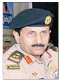
الضابط، الصابن بالمرسوم الملكي رقم (م / ٤٣) وتاريخ ١٣٩٣ / ٨ / ٢٨ هـ، المعدلة بالمرسوم الملكي رقم (م / ٥٤) بتاريخ ٢٦ / ٨ / ١٤٢٩ هـ. وبناء على ما عرضه سمو وزير الدفاع. أمرنا بما هو آت:

صدر أمر ملكي بترقية اللواء ركن عبد بن عوض بن عبد الشلوي إلى رتبة فريق ركن، وتعيينه قائداً للقوات البرية. وفيما يلي نص الأمر الملكي: بسم الله الرحمن الرحيم الرقم: ٩٧ / ١ التاريخ: ١٤٣٤/٤/٤ هـ بعون الله تعالى نحن عبدالله بن عبدالعزيز آل سعود ملك المملكة العربية السعودية والقائد الأعلى لكافة القوات العسكرية بعد الاطلاع على المادة (٢٧) من نظام خدمة الضباط، الصادر بالمرسوم الملكي رقم (م / ٤٣) وتاريخ ١٣٩٣ / ٨ / ٢٨ هـ، المعدلة بالمرسوم الملكي رقم (م / ٥٤) بتاريخ ٢٦ / ٨ / ١٤٢٩ هـ. وبناء على ما عرضه سمو وزير الدفاع. أمرنا بما هو آت: أولاً: يرقى اللواء ركن / عبد بن عوض بن عبد الشلوي إلى رتبة فريق ركن، ويعين قائداً للقوات البرية. ثانياً: على سمو وزير الدفاع تنفيذ أمرنا هذا.