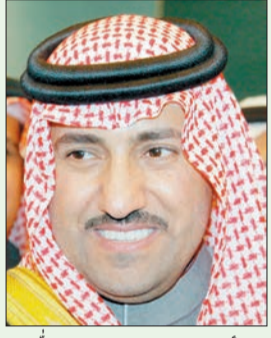
الأمير تركي بن عبد الله

- من مواليد ١ رمضان ١٣٩١هـ. - درس الابتدائية والمتوسطة والثانوية بمدارس الرياض، ومدارس نجد ومدارس الحرس الوطني. - التحق بكلية الملك فيصل الجوية وأمضى بها نحو أربعة أشهر ثم ابتعث للولايات المتحدة لمدة سنتين، وحصل على دورة تحضيرية ولغة طيران بقاعدة لاكند الجوية بولاية تكساس، وتعلم الطيران بناءً على تعليم من الطيارين ١١ ساعة طيران على طائرة سينا ١٧٢، وتدريب على طائرة سينا ١٥٢ بقاعدة مدينة الجوية بنفس الولاية وطائرة تي ٣٧ بقاعدة ولينز بولاية أريزونا لمدة ستة أشهر، وطائرة تي ٣٨ بنفس القاعدة لمدة ستة أشهر أخرى. - تلقى دورة على طائرة إف ١٥ بعد عودته من أمريكا، وذلك بقاعدة الملك فهد الجوية بالطائف لمدة ستة وثلاثة أشهر، وحصل على المركز الأول بالدورة، ثم تلقى دورة على طائرة إف ١٥ إس. - حصل على المركز الأول في دورة (إف ١٥ إس). - يعمل سموه في قاعدة الملك عبد العزيز الجوية بالظهران. - ترقى سموه إلى رتبة نقيب طيار في جمادى الآخرة ١٤١٨هـ (أكتوبر ١٩٩٧م)، وحصل على المركز الأول في دورة على مقاتلة (إف ١٥ إس) بتقدير ممتاز. - عين نائباً لأمير منطقة الرياض بمرتبة وزير في ٤/٤/١٤٢٤ هـ (٢٠١٣/٢/١٤ م).