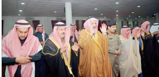
الأمير فهد بن بدر يؤدي صلاة الغائب على الفقيد في مسجد القصر بسكاكا.

أدى صاحب السمو الملكي الأمير فهد بن بدر بن عبد العزيز أمير منطقة الجوف صلاة الغائب على صاحب السمو الملكي الأمير سطم بن عبد العزيز آل سعود أمير منطقة