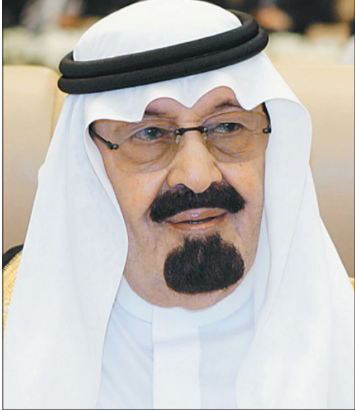
خادم الحرمين الشريفين

بن عبد العزيز آل سعود نائب أمير منطقة الرياض من منصبه بناء على طلبه. ثانياً: يعين صاحب السمو الملكي الأمير خالد بن بندر بن عبد العزيز آل سعود أميراً لمنطقة الرياض بمرتبة وزير. ثالثاً: يعين صاحب السمو الملكي الأمير تركي بن عبد الله بن عبد العزيز آل سعود نائباً لأمير منطقة الرياض بمرتبة وزير. رابعاً: يبلغ أمرنا هذا للجهات المختصة لاعتماده وتنفيذه.