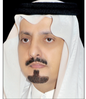
الأمير فيصل بن خالد