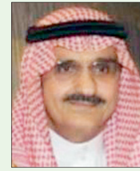
الأمير خالد بن بندر

- الأمير خالد هو الابن الثالث من أبناء الأمير بندر بن عبد العزيز آل سعود. - بعد إكمال دراسته الثانوية التحق بالسلك العسكري. - درس بالكلية العسكرية الأكاديمية البريطانية ساند هيرست. - بعد تخرجه التحق بالقوات البرية (سلاح المدرعات). - شغل منصب قائد القوات البرية الملكية السعودية. * الوزارات: - اشترك في دورة تأسيسية ودورة تخصصية على المعدات في معهد سلاح المدرعات. - حصل على دورة متقدمة دروع ودورة فنية صيانة في الولايات المتحدة (مدرسة دروع فورت نكس). - حصل على دورة قيادة وأركان في كلية القيادة والأركان في المملكة. - الأوسمة والنياشين والترقيات: - قلده الرئيس الباكستاني آصف زرداري نيشان هلال العسكري الذي يمنح ويقدم في باكستان للشخصيات العسكرية الأجنبية المتميزة. - في ٧/٢٨/١٤١٩ هـ أقامت قيادة سلاح المدرعات حفلاً بمناسبة ترقية سموه وتعيينه قائداً للسلاح. - صدر عام ٢٠١١ م مرسوم ملكي بترقيته إلى رتبة فريق ركن وتعيينه قائداً للقوات البرية الملكية السعودية. - صدر أمر ملكي رقم ٩٥/١ وتاريخ ٤/٤/١٤٢٤ هـ تضمن تعيينه أميراً لمنطقة الرياض بمرتبة وزير.