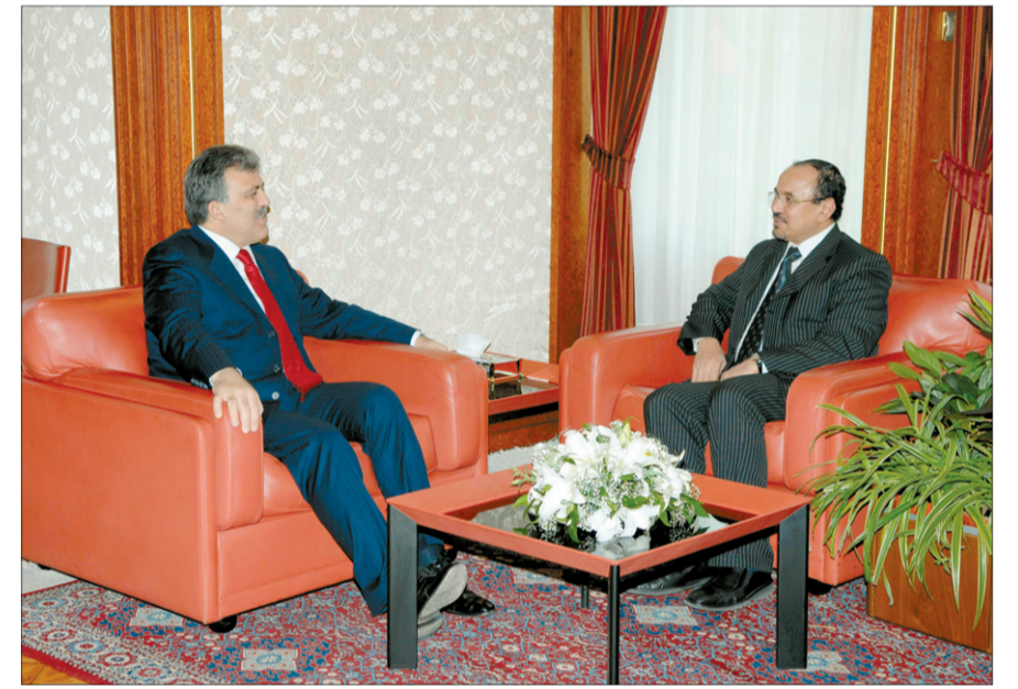
الرئيس التركي عبدالله غول يتحدث للزميل عبدالعزيز النهارى

أضاف الرئيس التركي بان المملكة وتركيا تعتبران دولتين كبيرتين ومهمتين في الشرق الاوسط وأن مواصلة التشاور بينهما امر طبيعي يفرضه هذه الامة خصوصا وأن المملكة وتركيا تعتبران من الدول المعتدلة والتي يعول عليها كثيرا في السياسة الدولية والتوازن في المنطقة. وردا على سؤال حول المواضيع التي ستطرق اليها مباحثات خادم الحرمين الشريفين الملك عبدالله وفخامته والتي اجريت امس قال ان هناك العديد من الموضوعات والقضايا التي تهم البلدين ولعل في مقدمتها التنسيق حول مؤتمر السلام القادم.. وفيما يخص القضية الفلسطينية والوضع في المنطقة وكذلك التنسيق حول المواقف الدولية ولاشك ان مراجعة ماتم تحقيقه على نطاق الشراكة الاستراتيجية بين البلدين والتنسيق ايضا في الاوضاع في العراق لاسيما وأن