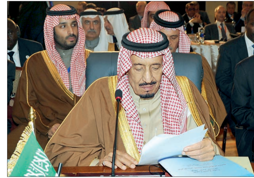
الأمير سلمان أثناء لقائه كلمة خادم الحرمين الشريفين في بدء أعمال القمة الإسلامية الـ ١٢ التي تستضيفها القاهرة.

عبدالله الداني (جدة) أكدت وزارة العدل أن قضية الطفلة المعنقة لى ما زالت محل نظر من القضاء، نافياً ما تداولته بعض الصحف والمواقع الإلكترونية ومواقع التواصل الاجتماعي بشأن الحكم على المتهم في القضية بدفع الدية. وأوضح المتحدث الرسمي لوزارة العدل