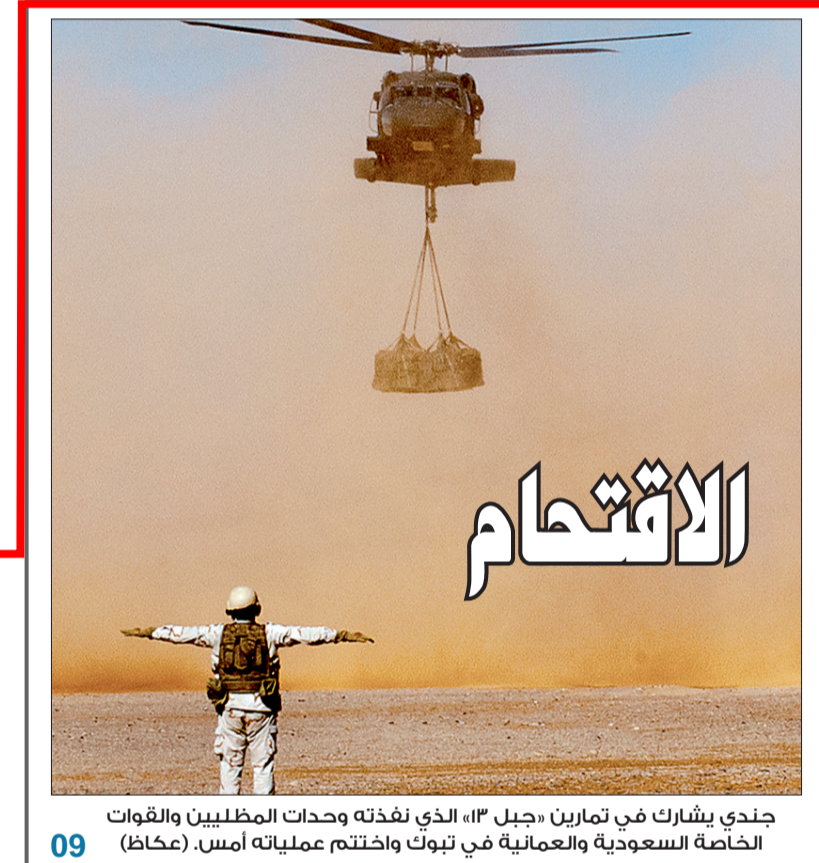
جندي يشارك في تمارين «جبل ٣» الذي نفذته وحدات المظليين والقوات الخاصة السعودية والعمانية في تبوك واختتمت عملياته أمس.