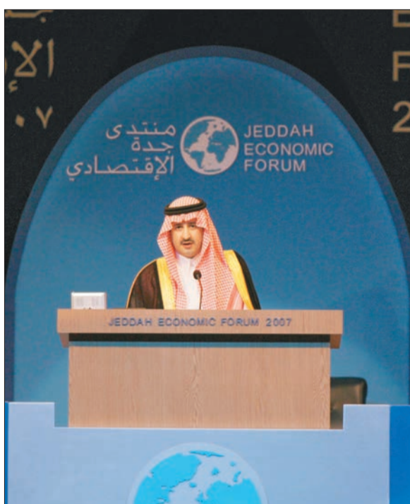
سموه بلقي الكلمة الافتتاحية نيابة عن الأمير عبدالمجيد

أكد صاحب السمو الملكي الأمير عبدالمجيد بن عبدالعزيز أمير منطقة مكة المكرمة أن خادم الحرمين الشريفين الملك عبدالله بن عبدالعزيز هو رائد الإصلاح في المملكة من خلال حرصه الدائم -بحفظه الله - على تحديث الأنظمة والقوانين الإسلامية وطرحه للإصلاحات الاقتصادية لتتواءم مع متطلبات العصر، وأشار سموه في كلمة القاها نيابة عنه صاحب السمو الملكي الأمير فيصل بن عبدالمجيد في حفل افتتاح المنتدى أن هذه النظرة نجحت في تحقيق الأمل والتطلعات وفيما يلي كلمة سموه: إن هذه الجلسة الافتتاحية تعيد إلى الذاكرة انطلاقاً منتدى جدة الاقتصادي في دورته الأولى قبل سبع سنوات وتحديداً عام ١٤٢٠هـ عندما قمت بافتتاح دورته الأولى بعد نشر في بتولي مهام إمارة منطقة مكة المكرمة.