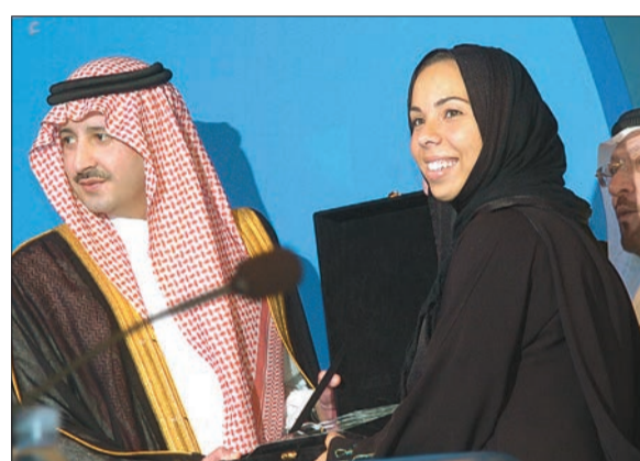
الأمير فيصل أثناء تكريم الطالبة بحرية