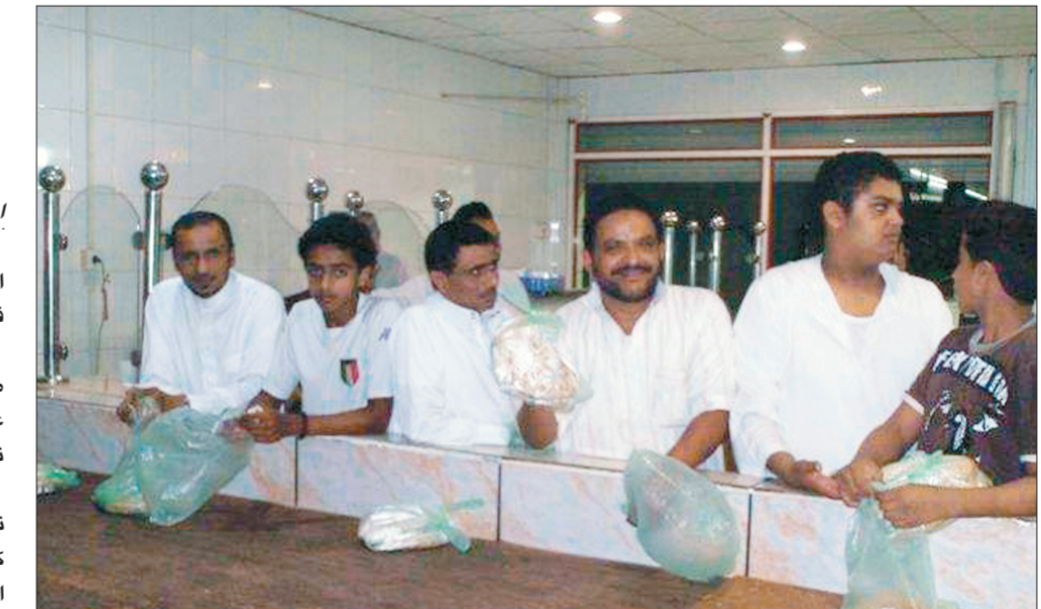
مواطنون ينتظرون فرصة الحصول على الخبز

احمد داود (فرسان) ادى عدم توفر الدقيق خلال الايام الماضية الى اغلاق بعض المخازن وبوفيهات الوجبات السريعة في فرسان وجراء هذه الازمة ارتفع سعر كيس الدقيق الى ٨٠ ريالاً مما جعل العديد من المواطنين يصطفون في طوابير امام المخازن للحصول على ما يمكن الحصول عليه من الخبز خصوصا ان فرسان تشهد هذه الايام تدفقا من الزوار. وقال صاحب احد المخازن انه اغلق مخبزه لعدم توفر الدقيق وازدادت اثاره بالرغم من ارتفاع سعر كيس الدقيق الى ما يقارب ٨٠ ريالاً الا اننا لم نستطع الحصول عليه وناشد المسؤولين في وزارة التجارة التدخل لحل هذه الازمة في اسرع وقت ممكن.