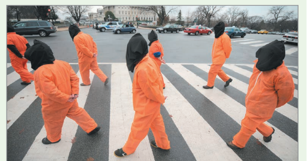
متظاهرون يرتدون الملابس البرتقالية مطالبين باغلاق المعتقل

الوكالات (عواصم) امتدت المظاهرات المناهضة لوجود معتقل جوانتانامو امس الى ٣٠ مدينة عالمية حيث طالب المتظاهرون بإغلاق المعتقل المشبه واطلاق جميع المعتقلين واعادتهم الى اوطانهم وهتف المتظاهرون «اغلقوا جوانتانامو.. كافحوا الارهاب بواسطة القضاء». وفي واشنطن تجمع المتظاهرون تحت المطر قرب الكونجرس وهم يرتدون زيا برتقاليا يرمز الى الزبي الذي يرتديه المعتقلون في جوانتانامو وكذلك الحال في باقي المدن التي شهدت المظاهرات. واقتحم ٣٦ متظاهرا في العاصمة الامريكية مقر المحكمة كما عثر على ٤٥ آخرون كانوا قد دخلوا مقر المحكمة في الصباح الباكر مدعدين باجراءات محاكمة المعتقلين وطالبوا بالافراج عنهم.