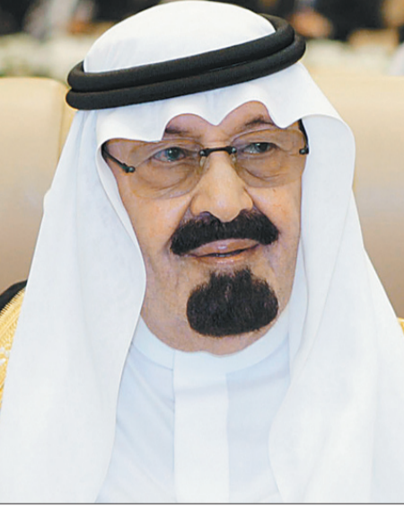
خادم الحرمين الشريفين

للتواصل أرسل sms إلى ٨٨٥٤٨ الاتصالات ٦٦٢٢٥٠٠ موبايلي ٧٣٧٧٠١ زين تبدا بالرمز ١٥٧ مسافة ثم الرسالة