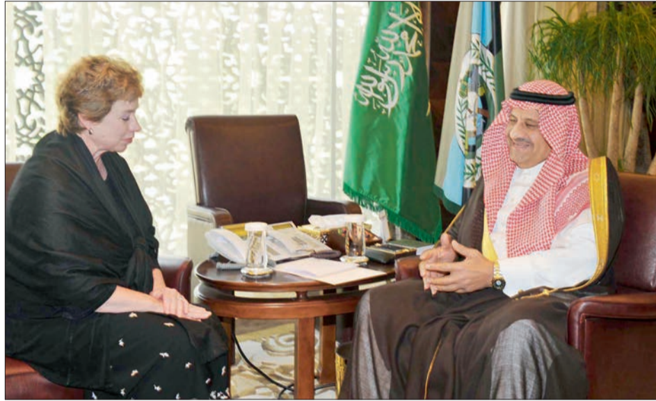
○ الأمير خالد بن سلطان مستقبلاً نائبة مساعد وزير الخارجية الأمريكية لشؤون تجارة الدفاع. ○

استقبل صاحب السمو الملكي الأمير خالد بن سلطان بن عبدالعزيز نائب وزير الدفاع بمكتب سموه بجدة أمس نائبة مساعد وزير الخارجية الأمريكية لشؤون تجارة الدفاع بيت ماكورومي. وتم خلال الاستقبال بحث العلاقات بين البلدين الصديقين والموضوعات ذات الاهتمام المشترك. كما استقبل سمو نائب وزير الدفاع أمس بمكتبه بجدة السفير الأسترالي لدى المملكة نيل هاوكينز. وجرى خلال الاستقبال تبادل الأحاديث الودية وبحث الموضوعات ذات الاهتمام المشترك. حضر الاستقبالين صاحب السمو الملكي الأمير نايف بن سلطان بن عبدالعزيز المستشار بمكتب سمو وزير الدفاع. ■