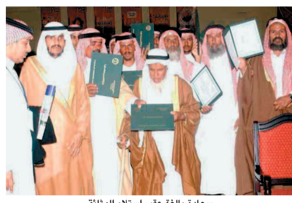
سعادة بالغة عقب استلام الوثائق