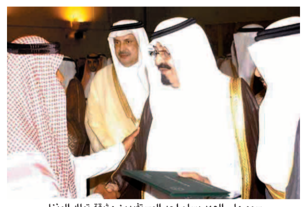
سمو ولي العهد يسلم احد المستفيدين وثيقة تملك المنزل

هناك احتياج.. واضاف ان المؤسسة بصدد وضع اللمسات الاخيرة لتطوير حي النخيل العشوائي بالمدينة المنورة مشيراً الى انه تم تحرير الاراضي المخصصة بالتعاون مع امانة المدينة المنورة وجرى حالياً دراسة الخرائط في شكلها النهائي تمهيداً للبدء في التنفيذ الذي سينعكس ايجاباً على الحي. وابان ان المشروع عبارة عن «١٠٠» منزل سيتم هدمها واعادة بنائها على نفقة المؤسسة، وسيتم أيضاً إنشاء مقر لادارة العامة حيث من المقرر تسليم الخرائط الخاصة بالمشروع الى المقاول خلال شهر من الآن وقال: تمثل هذه المشروعات المرحلة الاولى من خطة المؤسسة وتشتمل مرافق خدمية من مساجد ومدارس ومستوصفات ومراكز تدريب واجتماعية وادارية.